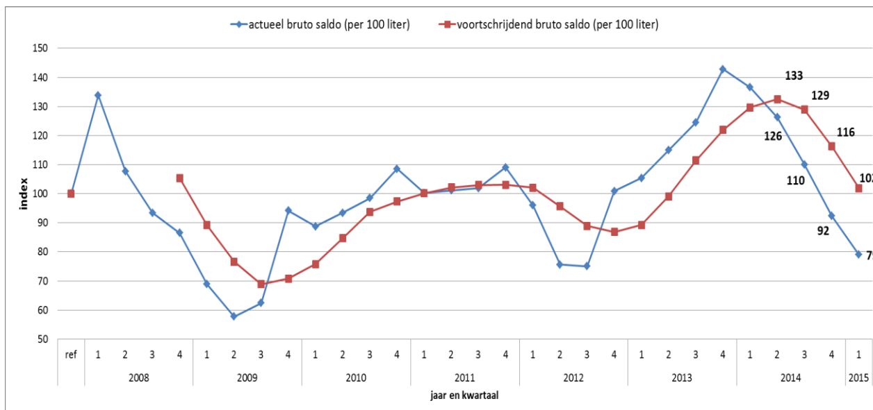
Figuur 2: Actueel en voortschrijdend bruto saldo per 100 liter melk, 2008-2014

Door de zeer gunstige economische situatie rond de jaarwisseling 2013-2014, heeft de minder gunstige situatie sinds begin dit jaar zich pas sinds het derde kwartaal van 2014 doorgezet in het voortschrijdend bruto saldo. In het voorbije kwartaal is de index sterk gezakt tot 102 en zit hiermee slechts iets hoger dan het gemiddelde tijdens de referentieperiode. Verwacht wordt dat deze index de komende maanden onder de 100 zal zakken.