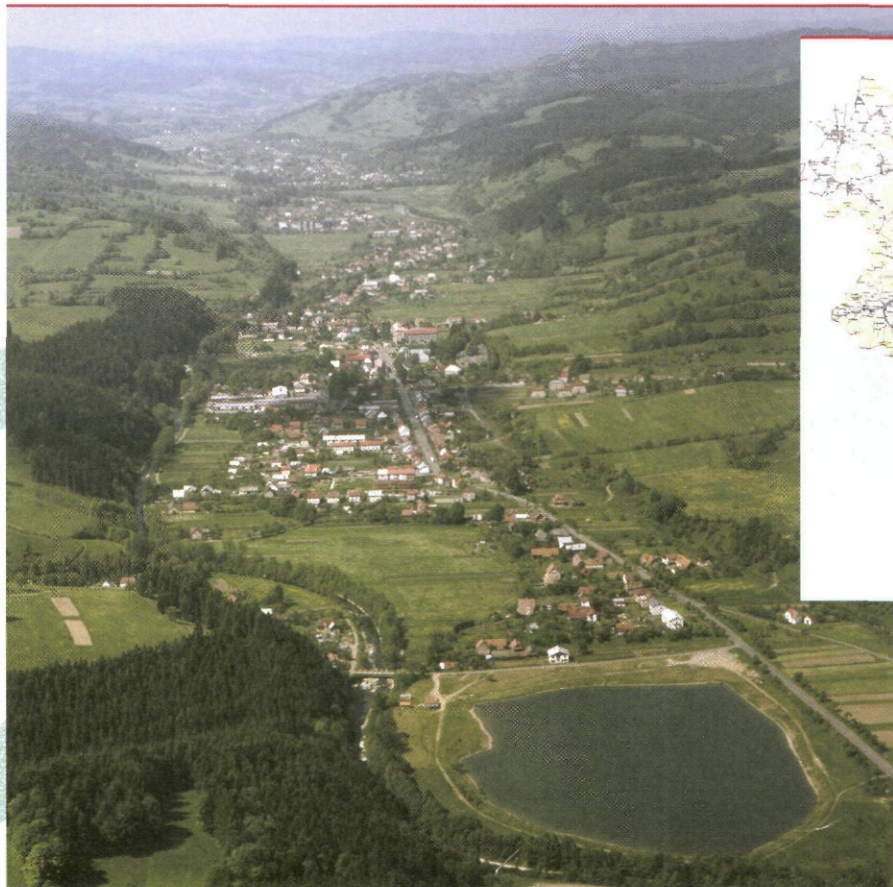
Het dal van de Becva in het oosten van Tsjechië.

Om dergelijke projecten te realiseren is niet alleen veel geld nodig, maar ook een degelijke kennis van de waterzuivering en van de ingewikkelde Europese subsidiekansen. Het Belgische bedrijf Aquaplus was de ontbrekende sleutel die toegang gaf tot het Europese ISPA-programma en tot het Vlaamse Samenwerkingsprogramma voor Centraal- en Oost-Europa. Aquaplus ontwikkelde de methode om het Europese aanvraagdossier op te stellen, zodat in de toekomst ook andere regio's gebruik kunnen maken van een gelijkaardig Europees traject. Deze keer hielp het bedrijf het regionaal ontwikkelingsagentschap ook bij het opstellen van het volledige Becva-dossier, een intensief en langdurig werk waarbij niet alleen het Regional Development Agency East Moravia als lokale projectmanager was betrokken, maar ook de opdrachtgever (de regio Vsetín) en een onderzoeksbureau.