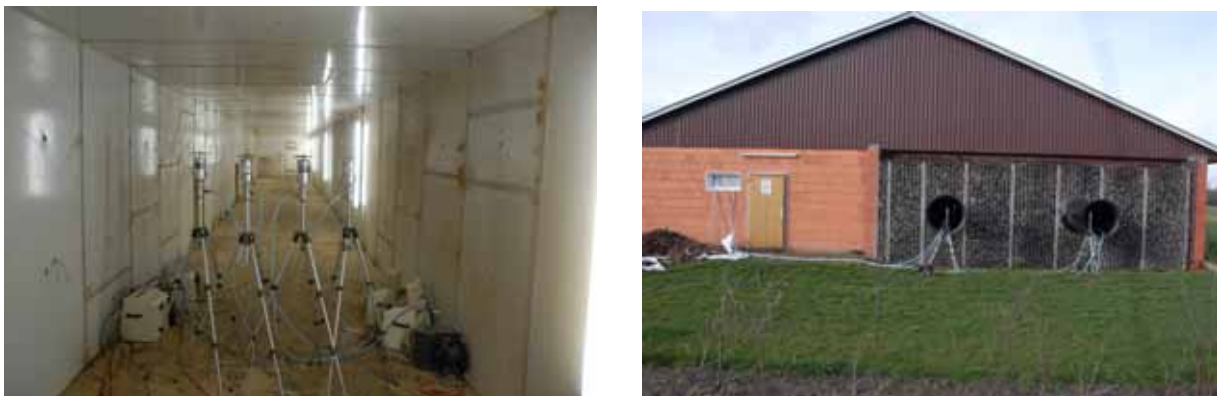
Figuur 3 Links: bemonstering van de ingaande stallucht in het centrale luchtkanaal; rechts: bemonstering van de uitgaande stallucht aan de buitenkant van het biofilter

Naast de bepaling van de fijn stofconcentraties zijn op dezelfde monsternamenpunten (in- en uitgaande lucht van de wasser) aanvullende metingen uitgevoerd. Tabel 3 geeft een overzicht van de metingen, de meetfrequentie en de meetmethode.