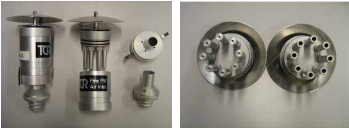
Figuur 2 Links de complete meetset en rechts het verschil in de openingen van de luchtinlaten boven de impactieplaat (grotere openingen voor PM10)