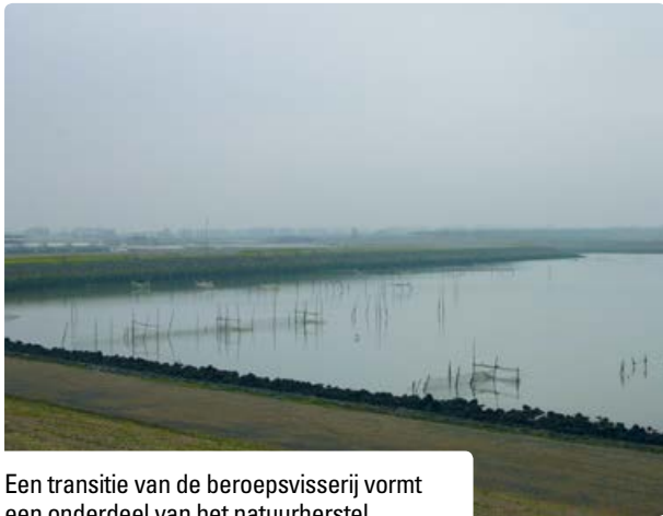
Een transitie van de beroepsvisserij vormt een onderdeel van het natuurherstel.