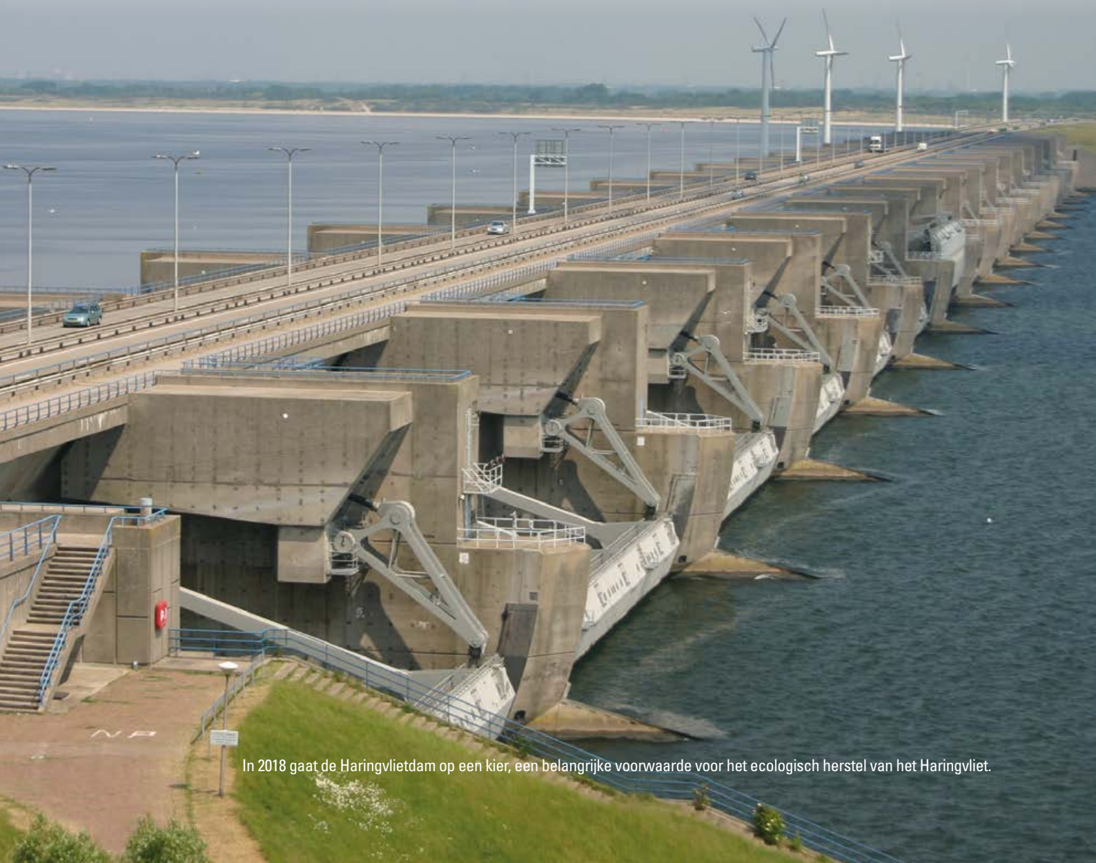
In 2018 gaat de Haringvlietdam op een kier, een belangrijke voorwaarde voor het ecologisch herstel van het Haringvliet.