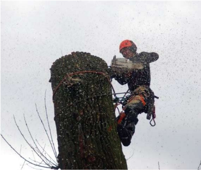
Klimmend demonteren van een populier.