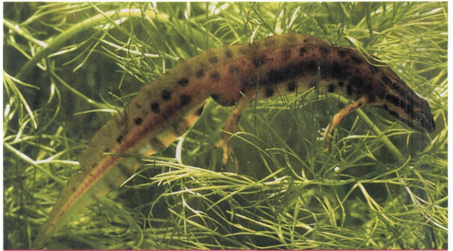
De kleine watersalamander is één van de soorten die vanaf 1 januari a.s. mag worden verstoord zonder dat daar vooraf een ontheffing voor is verkregen.

planten- en diersoorten zoveel mogelijk wordt voorkomen. Ook dan hoeft geen ontheffing te worden verkregen. Momenteel is de Unie van Waterschappen bezig met het opstellen van een dergelijke gedragscode. Enkele soorten die hierin genoemd kunnen worden, zijn de kleine modderkruiper, alpenwatersalamander, gevlekte orchis en rietorchis.