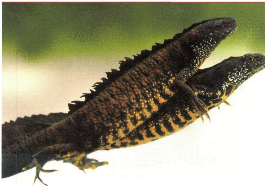
De kamsalamander blijft onder bescherming staan van de Habitatrichtlijn.