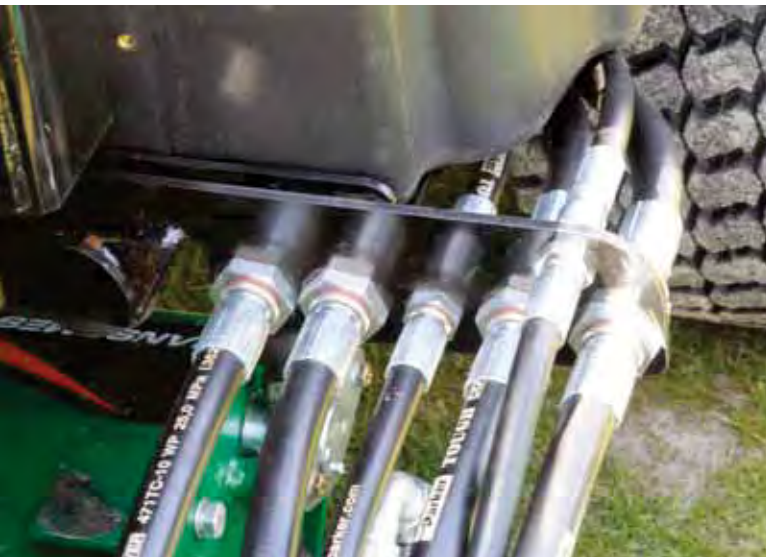
Deze Parker-hydrauliekslangen zijn roteerbaar aan de machinekant.