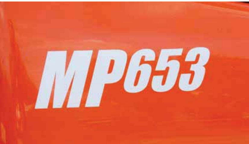
Alle machines zijn voortaan leverbaar in beide kleuren. Feitelijk bepaalt de klant de kleur, waarbij Jacobsen nog steeds de voorkeur heeft voor golf en Ransomes voor openbaar groen