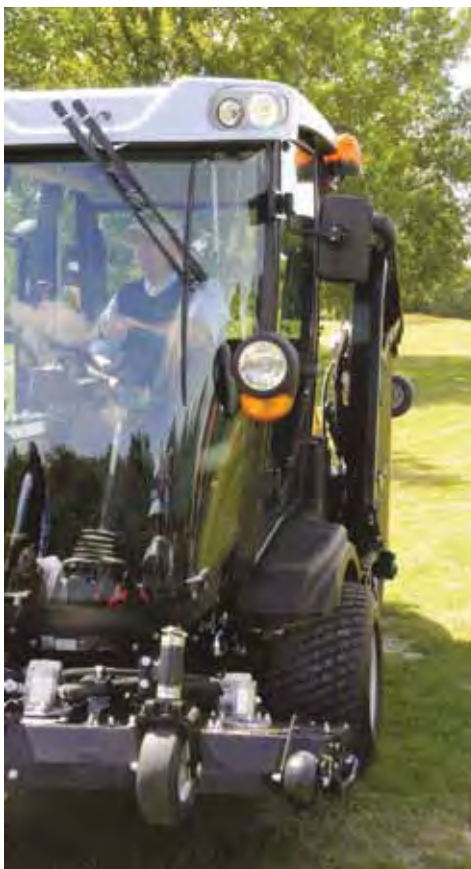
Maaidek klapt weg 'in' de machine, dus geschikt voor smalle doorgangen. Transportbreedte 1,65 meter; volgens Ransomes de smalste in zijn klasse.

Op de cirkeldeks, maar ook bij de kooien, worden de messen direct aangedreven door hydromotoren. Geen V-snaren, pulleys of andere vormen van