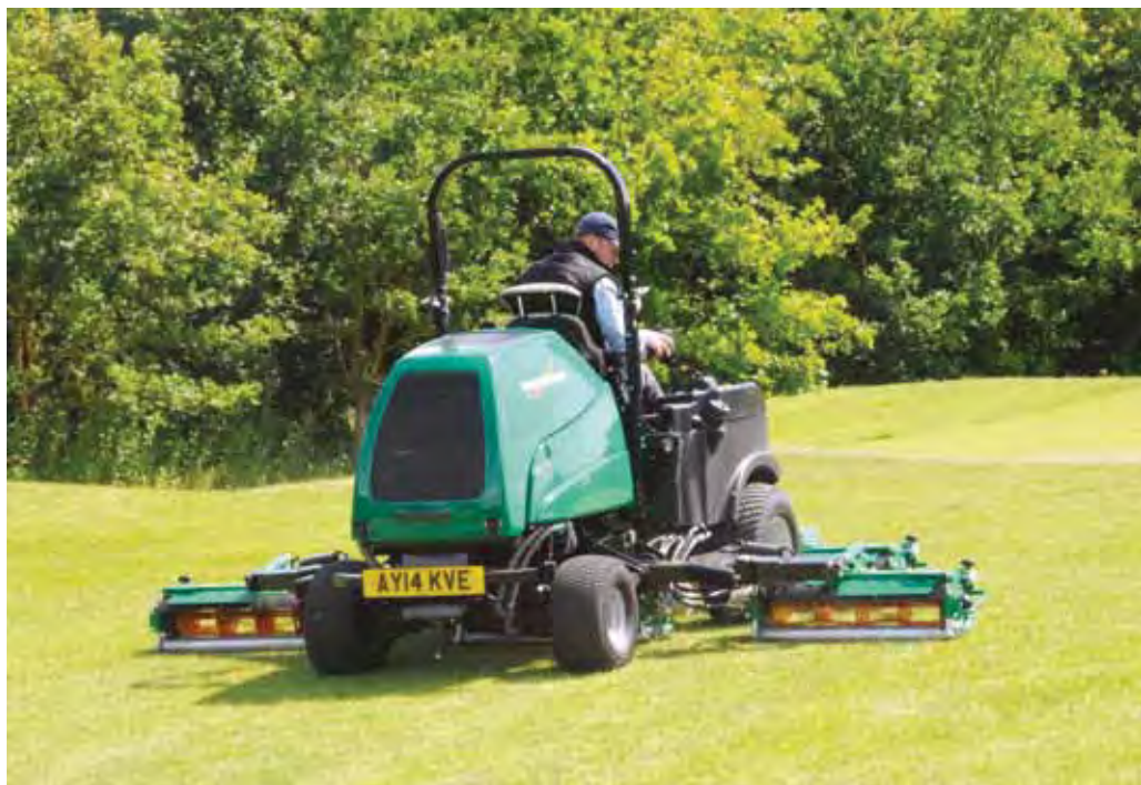
Vijfdelige Ransomes-kooimaaiër zonder cabine.

Ook al geef je ineens vol gas, de machine zal toch rustig reageren