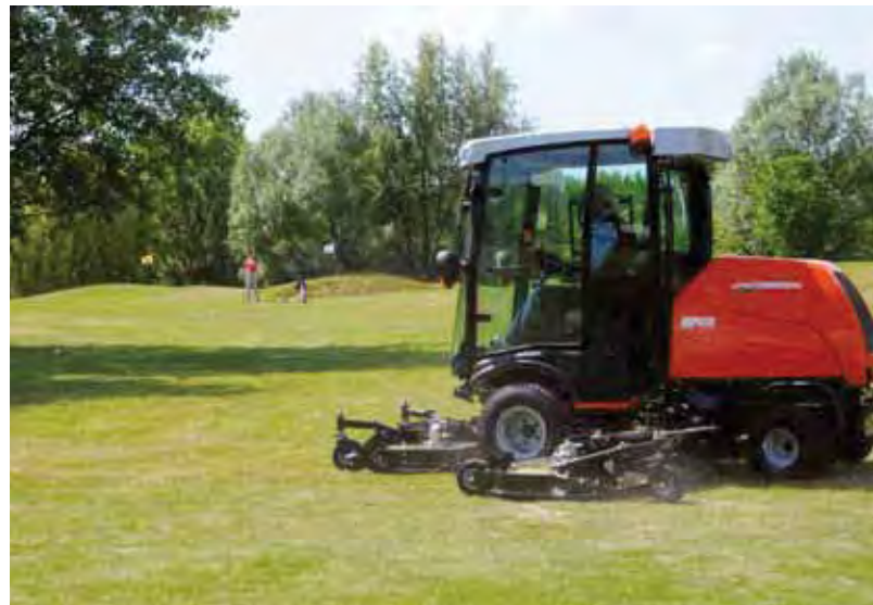
Jacobsen-cirkeldek met cabine.

wel fors in op de werkbreedte. Vergelijkbare machines zitten allemaal boven de 1,70 meter. Ransomes heeft dat bereikt door de slimme manier waarop de twee zijdekken zijn bevestigd. Als deze opklappen, beweegt het dek iets naar achter en vouwt het zich langs de maaier.