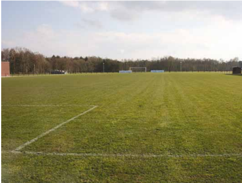
Veel velden liggen klaar voor de tweede seizoenshelft.