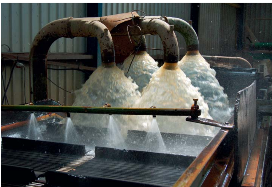
Het recirculeren van spoelwater is ook in het nieuwe Activiteitenbesluit geregeld

Alle milieuregels waaraan bloembollenbedrijven moeten voldoen zijn sinds 1 januari 2013 ondergebracht in het Activiteitenbesluit. Voor ondernemers zijn vooral zaken die betrekking hebben op water en bodem van belang. In twee artikelen licht BloembollenVisie toe waar ondernemers op moeten letten.