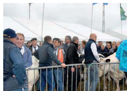
Wie het reglement op de naakte billen niet had gerespecteerd, werd de toegang tot de showring ontzegd