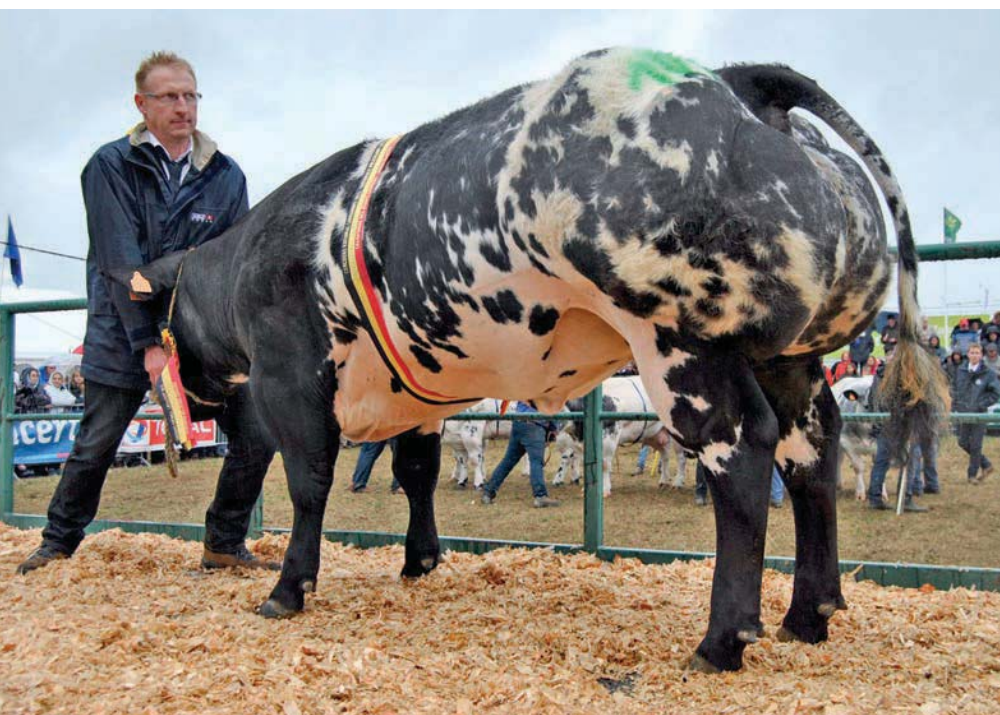
Ricaneuse de Fooz, kampioene jonge vaarzen