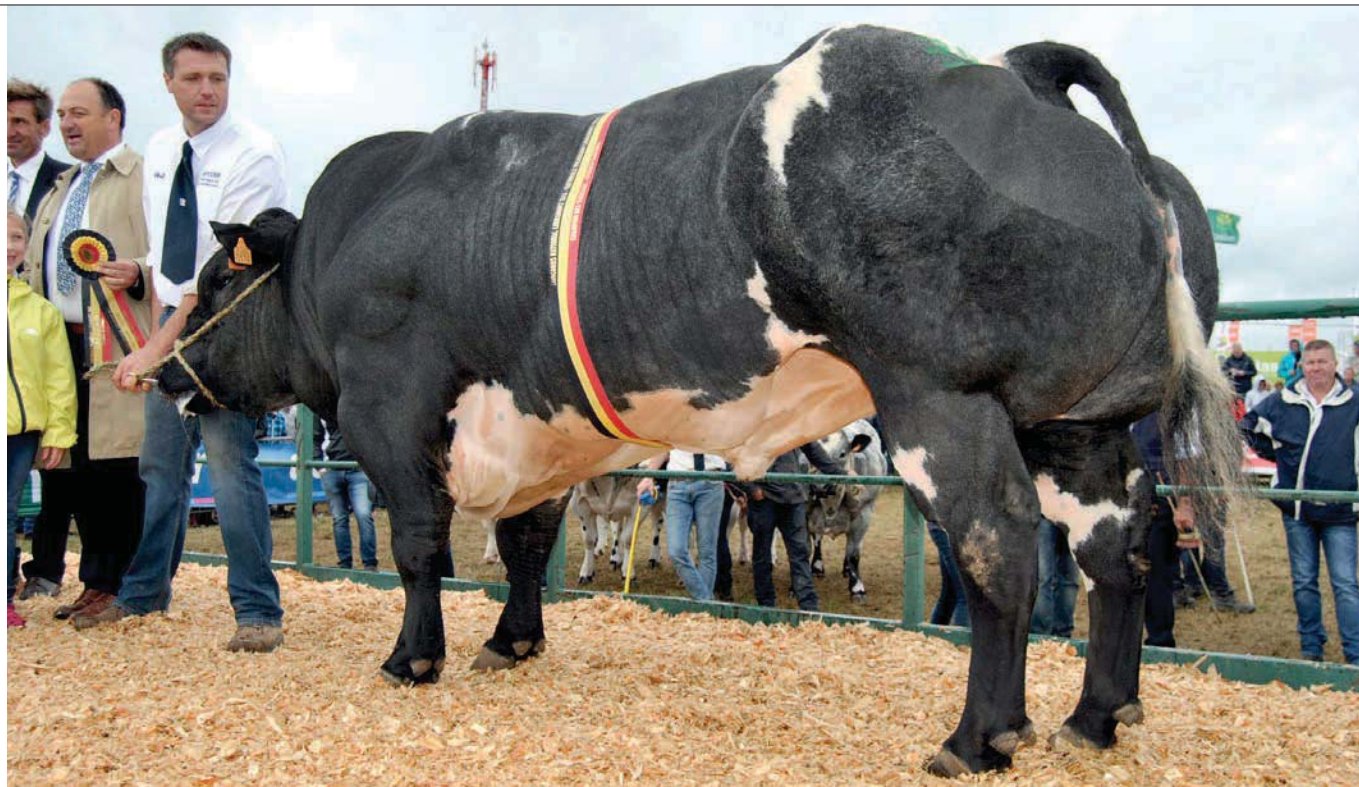
Pivert des Alleines, kampioen stieren en superkampioen 2015