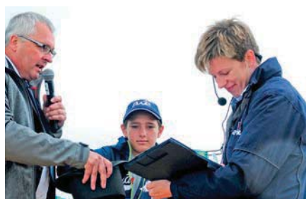
Welk jurylid welke diercategorie zou keuren, werd door lottrekking bepaald