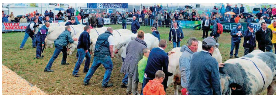
De kampioenskeuring bij de overwegend 'witgekleurde' koeien