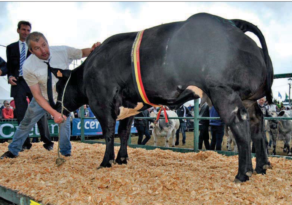
Riante du Grand Courty, kampioene vaarzen en gekalfde vaarzen

bij hoogdringendheid gewerkt worden. Dat was 'aardig' kort en dat is een understatement.