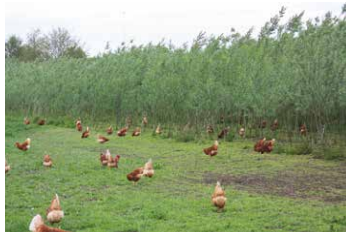
> Kippen in een 2 jaar oude plantage