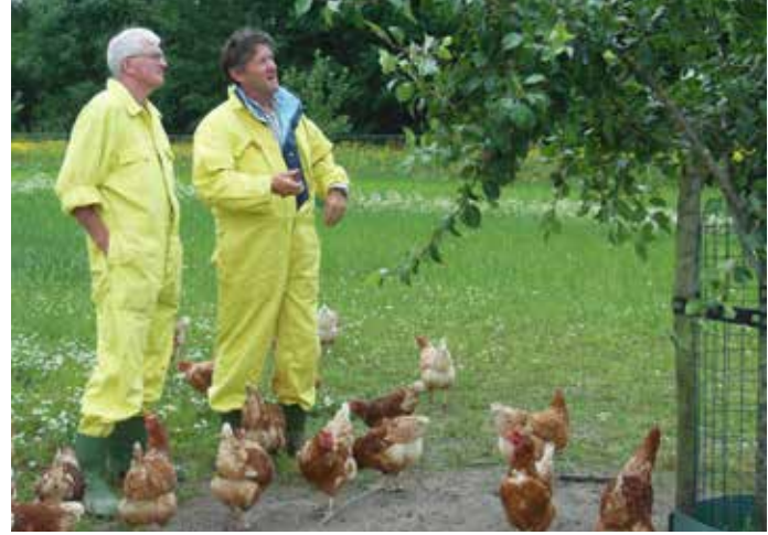
Soms is het nodig vakkennis in te huren