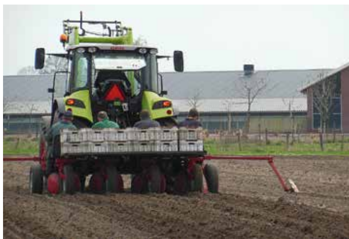
Het planten van de miscanthus bij Wim de Vries in Terschuur

Het enige werk dat je aan miscanthus hebt, is onkruidbestrijding, en dat kost veel tijd: in het eerste jaar na aanplant 59 uur per hectare, in het tweede jaar 28 uur en de hoeveelheid werk in latere jaren zal waarschijnlijk minder uren zijn tot geen. Het onkruid kan tot een gewashoogte van 15 centimeter nog met de wiedege beheerd worden en tot een gewashoogte van 40 centimeter met een schoffelmachine.