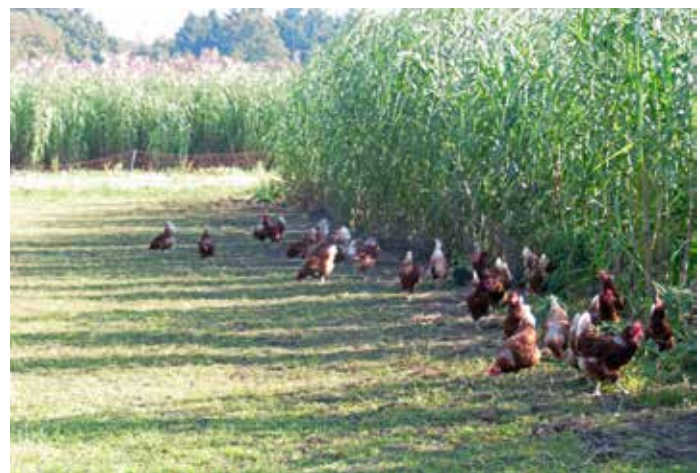
Miscanthus in de uitloop van Wijnand van de Mheen in Terschuur

Op 2 mei 2013 is op drie bedrijven totaal 3,5 ha miscanthus aangeplant. Twee bedrijven pootten de knollen in schone grond en miscanthus was het enige gewas. Het derde bedrijf zaaide graan tussen de miscanthus, met als doel dat het graan het onkruid zou onderdrukken. Het vorige gewas op de percelen was gras, maïs of het was kaal gescharreld en