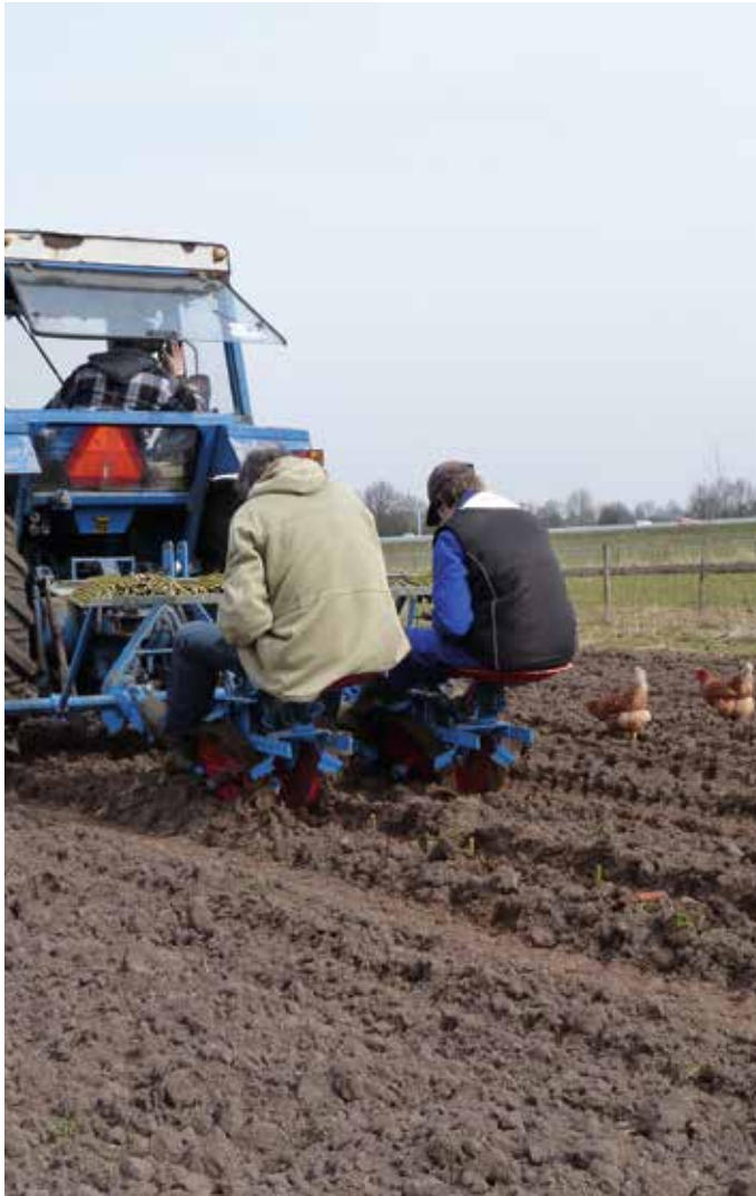
Aanplant van wilgen met een Superprefer plantmachine met twee plantelementen. De stekken worden bij aanplant bijna helemaal in de grond gestoken.