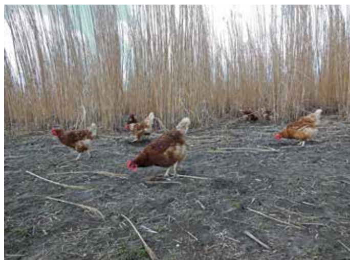
Miscanthus in de winter