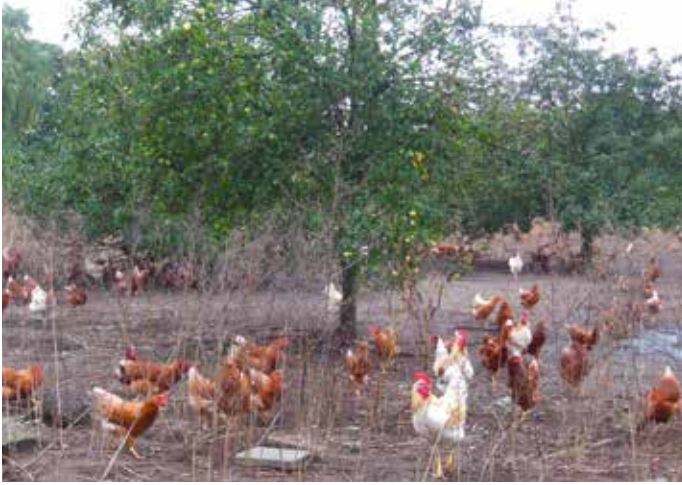
Appelbomen zonder onderhoud of bescherming