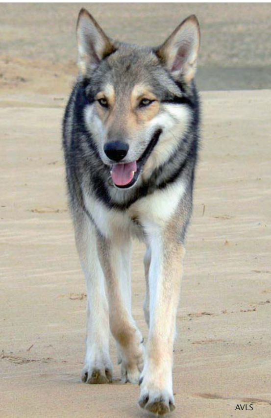
Volwassen Saarloos wolfhond

het te verbeteren ras (maximaal 20%). Het gekruiste nest wordt vervolgens streng beoordeeld naar gedrag, gezondheid, uiterlijk en gebruiksdoel (de rasstandaard). Alleen de reuen en de teven die op deze onderdelen overeenkomsten hebben met het eigen ras mogen ingezet worden in een terugkruising met het eigen ras. Dieren die te weinig overeenkomst vertonen om mee verder te fokken, worden op jonge leeftijd gecastreerd.* Ook de nestjes uit de tweede (terug)kruising worden streng beoordeeld en als ze niet gebruikt mogen worden voor de fokkerij, gecastreerd. De overgebleven reuen en teven met 25% vreemd bloed leveren een aanzienlijke bijdrage aan het vergroten van de