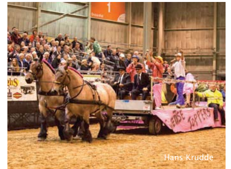
Shownummer: muzikale carrousel