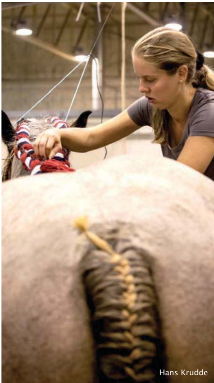
Immaterieel erfgoed: invlechten

uit het land samenkomen. Na de oprichting van het stamboek in 1914 werd in 1923 de eerste keuring, 'Nationale Tentoonstelling' genoemd, georganiseerd in Den Haag. Daar verschenen ruim vijfhonderd trekpaarden en ook de publieke belangstelling was groot. Vanaf 1932 wordt de Nationale Tentoonstelling in de Veemarkthallen, nu Brabanthallen, in Den Bosch gehouden. Opvallend is dat ondanks de grillige geschiedenis van de trekpaarden, waarin de wereldoorlogen