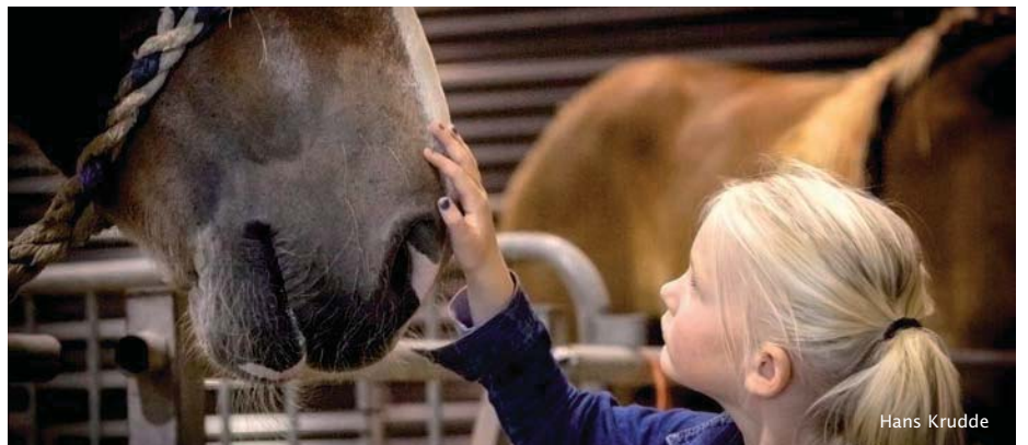
Groot en lief