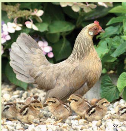
Hollandse kriel, altijd populair geweest op een boerenerf

De les 'Met een appel en een ei' gaat over appels en kippen. Welke kleuren en maten hebben ze? Hoe smaken de ver-