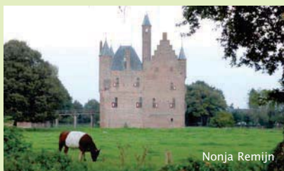
Lakenvelder, het ras dat bij kastelen hoort

voor hen favoriet is en waarom. Dat vertellen ze dan aan elkaar aan het eind van de dag in de klas met een mooie presentatie, gemaakt op de computer.