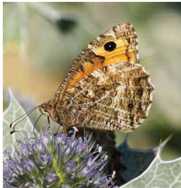
Heivlinder op blauwe zeedistel.

op 100% gesteld is. Met andere woorden: als we op Texel, ondanks de afname van de index, nog steeds behoorlijke aantallen heivlinders zien betekent dat dat de aantallen ruim twintig jaar geleden nog véél hoger waren.