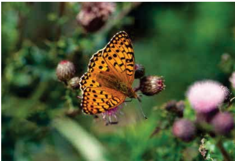
De duinparelmoervlinder kruipt langzaam uit het dal.

Op grond van jarenlange tellingen blijkt het mogelijke de aan het begin van dit artikel gestelde vraag of Texel voor de genoemde 'zorgenkindjes' nu wel of