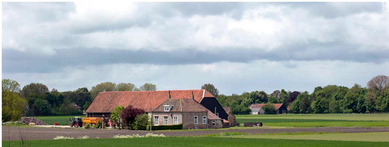
Boerderij met akker in Noordgouwe, Zeeland. Dergelijke bedrijven krijgen te maken met de 5% vergroeningseis in de vorm van een EFA.