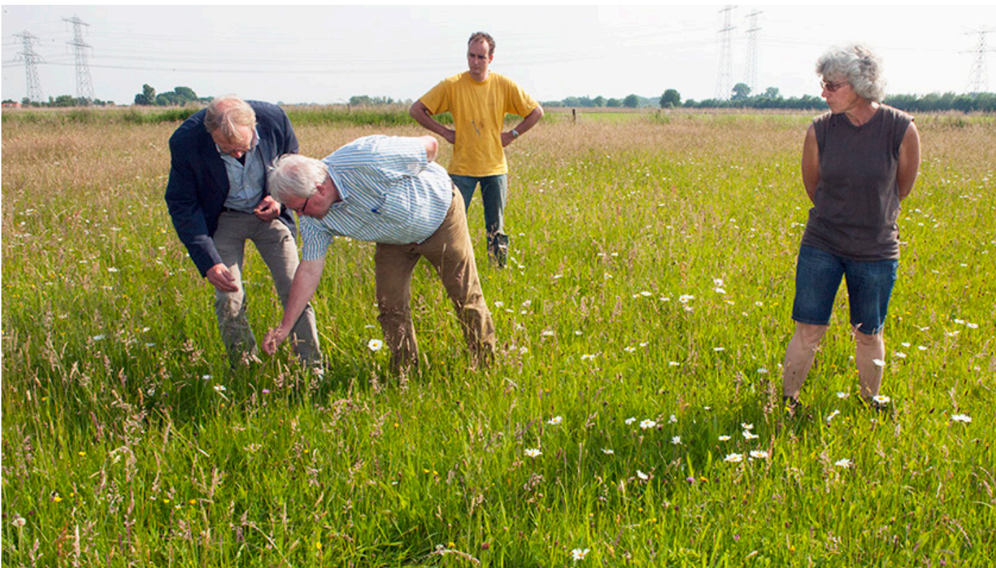
Hooilandinspectie van een bloeiende akker nabij Hasselt

Vliegdennen werden in de 19e eeuw aangeplant in de zandgebieden om te voorkomen dat de grond ging verstuiven en om akkers te beschermen. Daarnaast werd dennenhout gebruikt in de mijnbouw in Limburg: dennenhout kraakt als er te veel druk op staat, wat mijnwerkers waarschuwde voor gevaar.