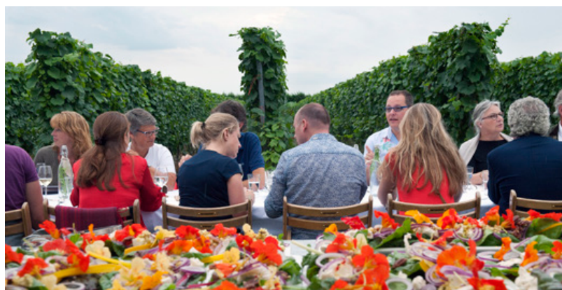
Eten in de wijngaard in Zeeland. Dergelijke evenementen dragen bij aan versterking van de stad-land relaties en zorgen voor extra inkomsten.