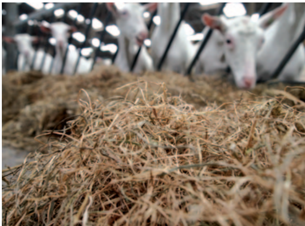
Smakelijk, goed ruwvoer maakt dat de geiten van de familie Nootboom goed produceren.

Al het landwerk voert de familie zelf uit, behalve het persen. Twee zoons van Cees en Anita helpen veel met trekkerwerk.