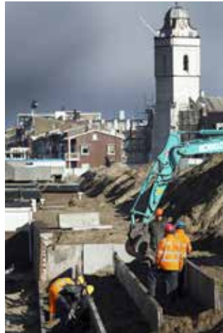
Heel Katwijk ligt nu veilig binnendijks