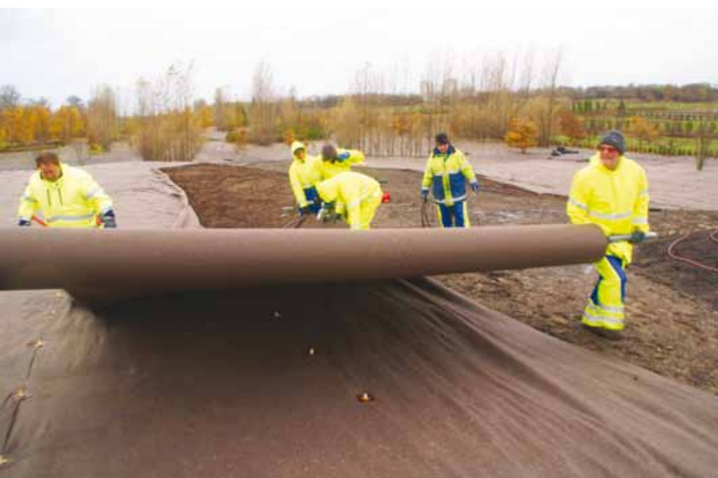
Aanleg van onkruiddoek voor een project in Malmö.