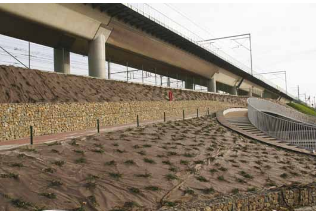
Project op een spoorwegtalud in Gent.

De juten vezels begonnen te degraderen; hier en daar groeide er onkruid door de mat. De andere doeken functioneerden goed. Na veertien maanden bleek de levensduur van het juten doek onvoldoende; het onkruid groeide door het doek heen. Het synthetische weefsel werkte goed, maar ter hoogte van de pinnen – om het doek op de helling vast te zetten, nodig op elk type gronddoek – groeide hier en daar onkruid. Ook de kokosvezels degradeerden snel; de zwarte