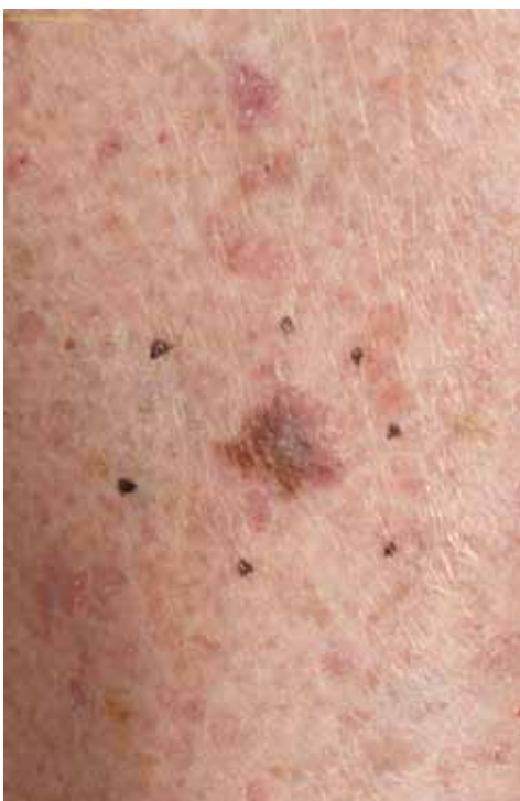
Een melanoom is vaak een asymmetrische moedervlek-achtige plek, is onregelmatig begrensd, laat vaak meerdere kleuren zien en is meestal groter dan 6 mm.