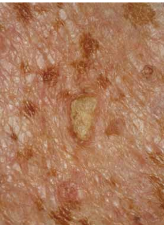
Zonneschade met actinische keratosen op een kalend hoofd.

Ga naar je huisarts als je een van deze kenmerken ontdekt. Het is misschien nogal wat om al je moedervlekken in de gaten te houden, maar zo wordt huidkanker op tijd ontdekt en is een goede behandeling bijna altijd mogelijk.