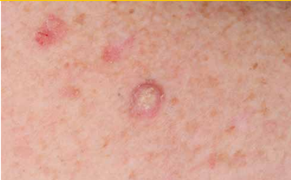
Een plaveiselcarcinoom ziet er vaak uit als een huidkleurig of lichtrood bultje, vaak met een ruw aanvoelend oppervlak. Het kan overal op het lichaam voorkomen. Er bestaat echter een voorkeur voor de schedelhuid, de oren, het gezicht, de lippen, de onderarmen, de handruggen en de benen.