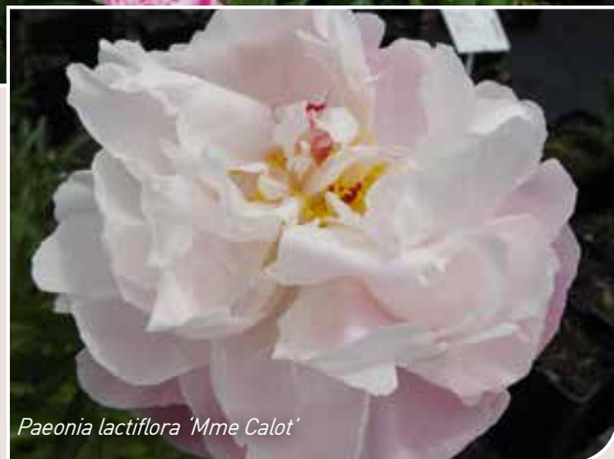
Paeonia lactiflora 'Mme Calot'

Pioenen worden opgedeeld in twee grote groepen: boompioenen (= P. suffruticosa ) groeien uit tot forse struiken. Ze zijn de eerste om te bloeien maar daardoor ook vorstgevoeliger.