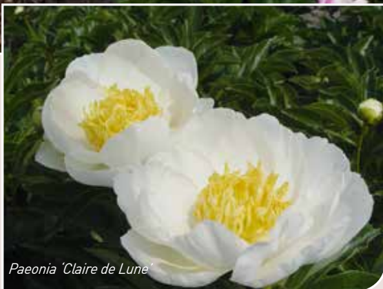
Paeonia 'Claire de Lune'