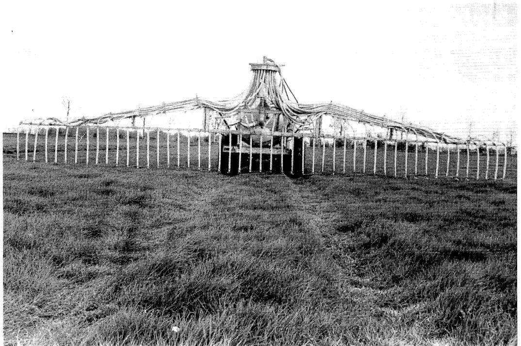
Sleepslangenmachine voor exact verdelen van aangezuurde mest.

Het aanwenden van aangezuurde mest kan normaal bovengronds plaatsvinden, maar moet wel