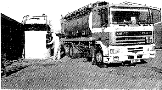
Vullen van het vat met aanzuurmiddel.