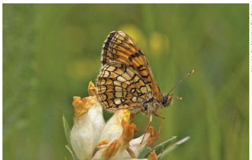
Melitaea parthenoides .