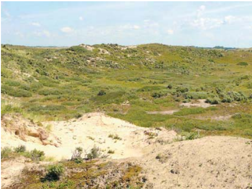
Geschikt leefgebied voor de duinparelmoervlinder in het Zeeveld van de Amsterdamse Waterleidingduinen.

in Zuid-Holland voorkomt. Daarentegen lijkt het voorkomen tussen Castricum en Bergen aan Zee min of meer stabiel.