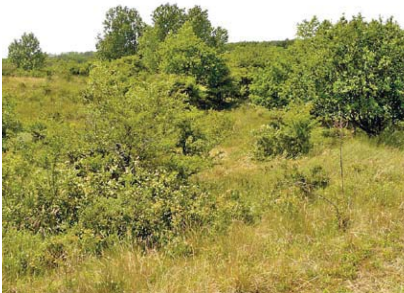
Het dichtgroeien van het mozaïek van duingrasland en struweel is het grootste probleem voor de duinparelmoervlinder in Kennemerland.