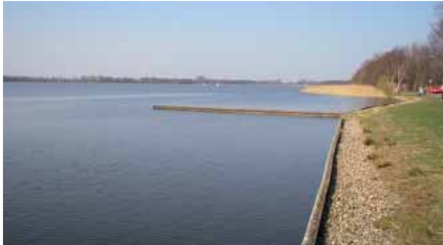
Het Nanneewijd

basis van een beperkte groep meren waar we lange termijn gegevens van hebben, vallen veel meren terug in kwaliteit na een lange periode (meer dan tien jaar). Waardoor dat komt is nog onduidelijk, maar het lijkt erop dat in veel gevallen de externe nutriëntenbelasting te hoog is gebleven. Dit betekent dat effectgerichte maatregelen regelmatig herhaald moeten worden om de ecologische doelstellingen op korte termijn te bereiken, terwijl op de langere termijn aan de brongerichte maatregelen gewerkt moet worden.