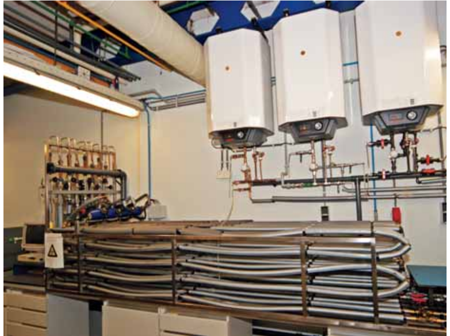
De gebruikte proefleidinginstallatie met huishoudelijk tappatroon.

Tijdens het onderzoek is vastgesteld dat de relatief kleine 'dode' leidingstukjes met een lengte van enkele centimeters, die ontstonden bij het dichtdraaien van de afsluiters rond de circulatiepomp aan het eind van een opkweekfase, verantwoordelijk waren voor een onjuist beeld van de concentratie legionellabacteriën in het getapte water. Terwijl in de onderzoeksfase bij 60°C in de biofilm al langere tijd geen legionellabacteriën meer werden aangetroffen, bevatte het getapte water nog steeds legionellabacteriën. Na demontage werd de inhoud van de dode leidingstukjes bemonsterd en geanalyseerd. Hierbij werden zeer hoge concentraties L. pneumophila vastgesteld (tot 2 \times 10^6 kve/l). Het vermoeden ontstond dat een klein deel van de legionellabacteriën vanuit deze dode leidingstukjes in de watermonsters terecht waren gekomen, waardoor het resultaat niet meer representatief is voor het water in de bemonsterde leiding. Deze