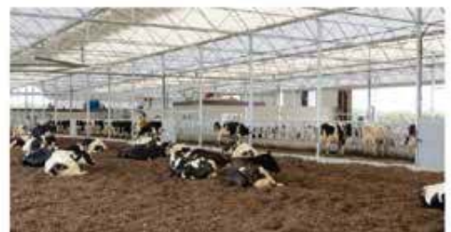
Afh. 3.2 De melk van een aantal melkveestal kan filterresistente bacteriën bevatten.