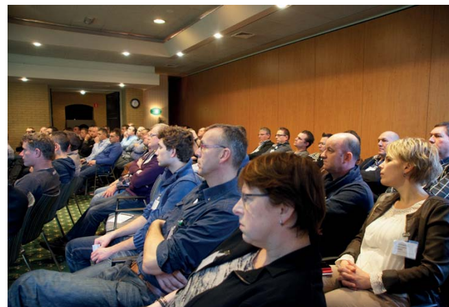
Telkens volle zalen bij de workshops, of het nu ging om bieten raffineren of om de Google Glass.