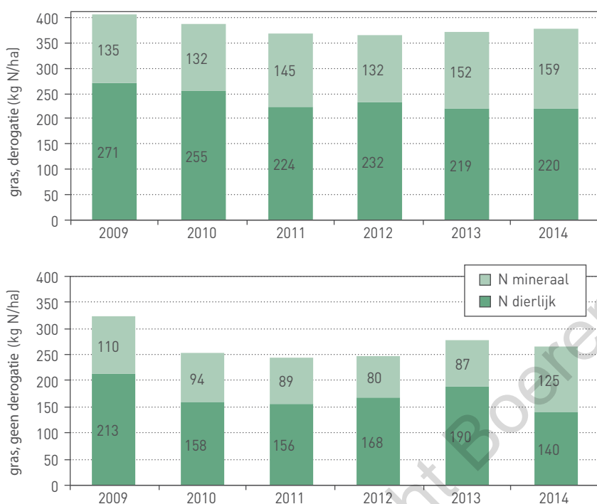
Figuur 3 Overzicht van de gemiddelde dierlijke en minerale stikstofbemesting (kg N/ha/jaar) voor derogatie- en niet-derogatiepercelen met grasland in het meetnet voor de periode 2009-2014

Naast de eerder vermelde nitraatmetingen in bodem en water werden ook andere parameters opgevolgd, zoals de bodemvruchtbaarheid en de fosfortoestand. Hiervoor werd P-Al gemeten op de bouwlaag en voor een selectie van percelen ook in de diepere lagen. Op de waterstalen werd steeds orthofosfaat (PO 4 3- ) mee gemeten. Omdat de processen voor fosfor heel wat complexer zijn in vergelijking met die voor nitraat, was het niet altijd mogelijk een vergelijking te maken tussen derogatie- en niet-derogatiepercelen. Naast de metingen werden nog verschillende berekeningen gemaakt zoals de nutriëntenbalansen en ook enkele modelmatige doorrekeningen om bijvoorbeeld het effect van derogatie naar het oppervlaktewater te begrootten.