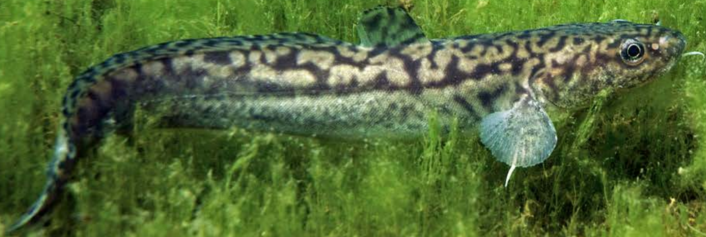
Kwabaal boven een veld met kranswier.

TEKST Jeroen Bosveld, Bureau Submers ILLUSTRATIES Jeroen Bosveld en Ronnie Veldkamp