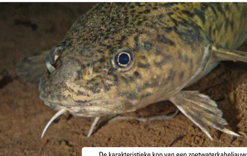
De karakteristieke kop van een zoetwaterkabeljauw.

De IJssel-Vechtdelta is van oudsher een belangrijk gebied voor de kwabaal. Hoewel historische waarnemingen uit de eerste helft van de vorige eeuw groten-deels ontbreken blijkt uit anekdotische informatie dat de soort in de jaren vijftig nog relatief algemeen in het gebied voorkwam, vooral in de Weerribben-Wieden. Waarnemingen uit de IJssel-Vechtdelta zijn geregistreerd sinds 1952 en hoofdzakelijk gebaseerd op elektrovisserij, fuik- en hengelvangsten. De meeste waarnemingen na 2000 zijn afkomstig van de plaatselijke beroepsvisser in het gebied. Vooral vanaf 2006 neemt het aantal waarnemingen en gevangen kwabalen sterk toe. Het gaat hoofdzakelijk om vangsten in de randmeren rond Flevoland. De toename blijkt ook uit de gegevens van de MWTL-monitoring, maar dan iets later. In 2010 werden voor het eerst in zestien jaar kwabalen