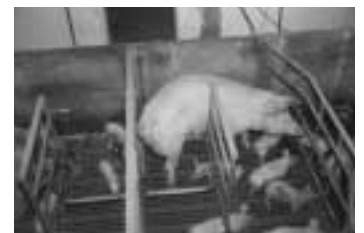
Loslopende zeug in kraamhok