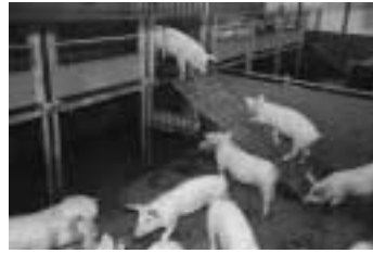
Plateau bij vleesvarkens