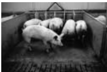
Zeugen met trogvoeding