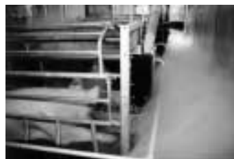
Kraamafdeling met ondergronds luchtinlaatsysteem