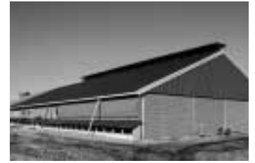
Economisch duurzame vleesvarkensstal