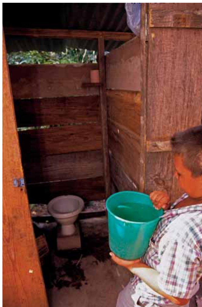
Jongetje gaat toilet doorspoelen op platteland van Honduras.