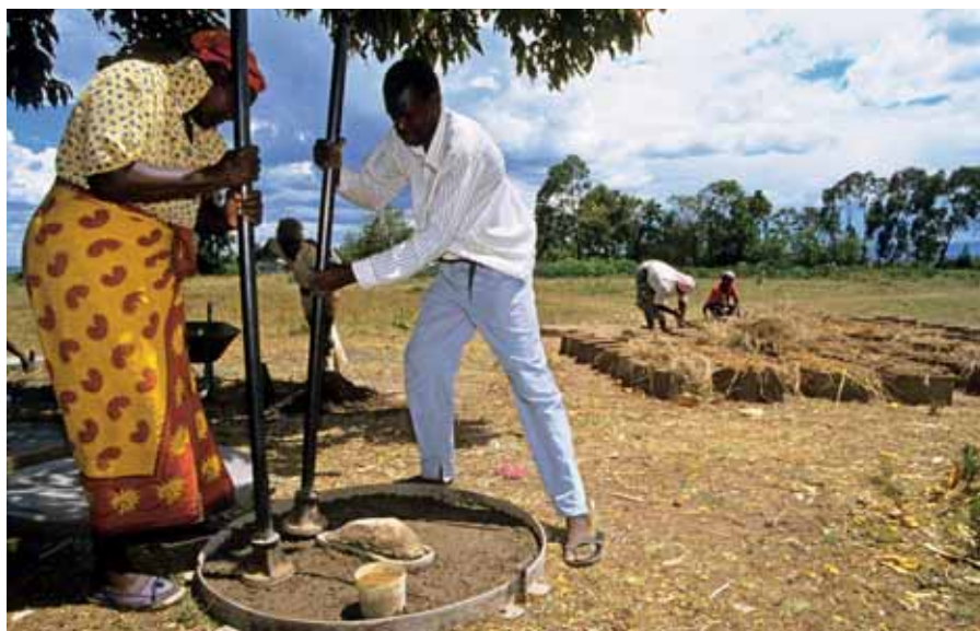
Dorpelingen in Kenia maken zelf toiletten, met steun van ontwikkelingsorganisatie.