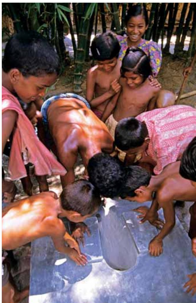
Kinderen bewonderen de betonnen bodem van een hurklatrine dat in het dorp in Bangladesh gebouwd wordt, de eerste op deze plek, waar voorheen de mensen in de bossen hun behoeften deden.