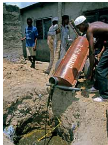
In een sloppenwijk van Dar es Salaam wordt ontlasting in een beerput geleegd. Dit handzame strontkarretje met een eenvoudige pomp is speciaal gemaakt om in de nauwe straatjes van sloppenwijken waar geen riolering is en een normale tankwagen niet kan komen, toch de ontlasting van de huishoudens op te halen en af te voeren.