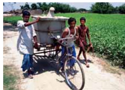
Een familie in Bangladesh vervoert cementen onderdelen van een te bouwen latrine, via een ontwikkelingsproject gekregen, terug naar hun dorp.