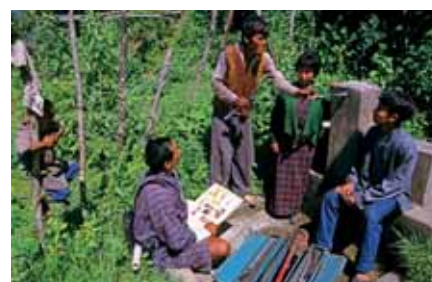
Lokale ontwikkelingswerker adviseert boeren over de aanleg en het onderhoud van een kraan in Bhutan.