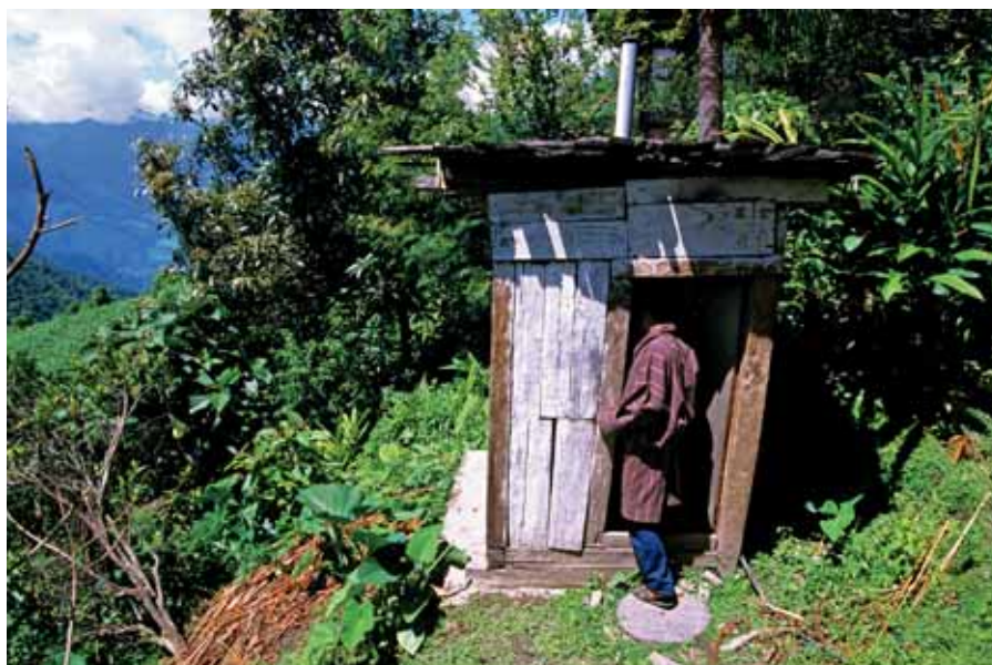
Toilet buiten op het platteland van Bhutan.