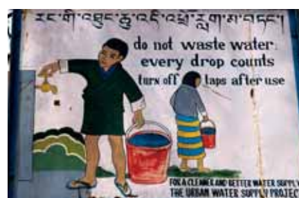
Voorlichting in een stadje in Bhutan over het belang van schoon water en de noodzaak er zuinig mee om te gaan.