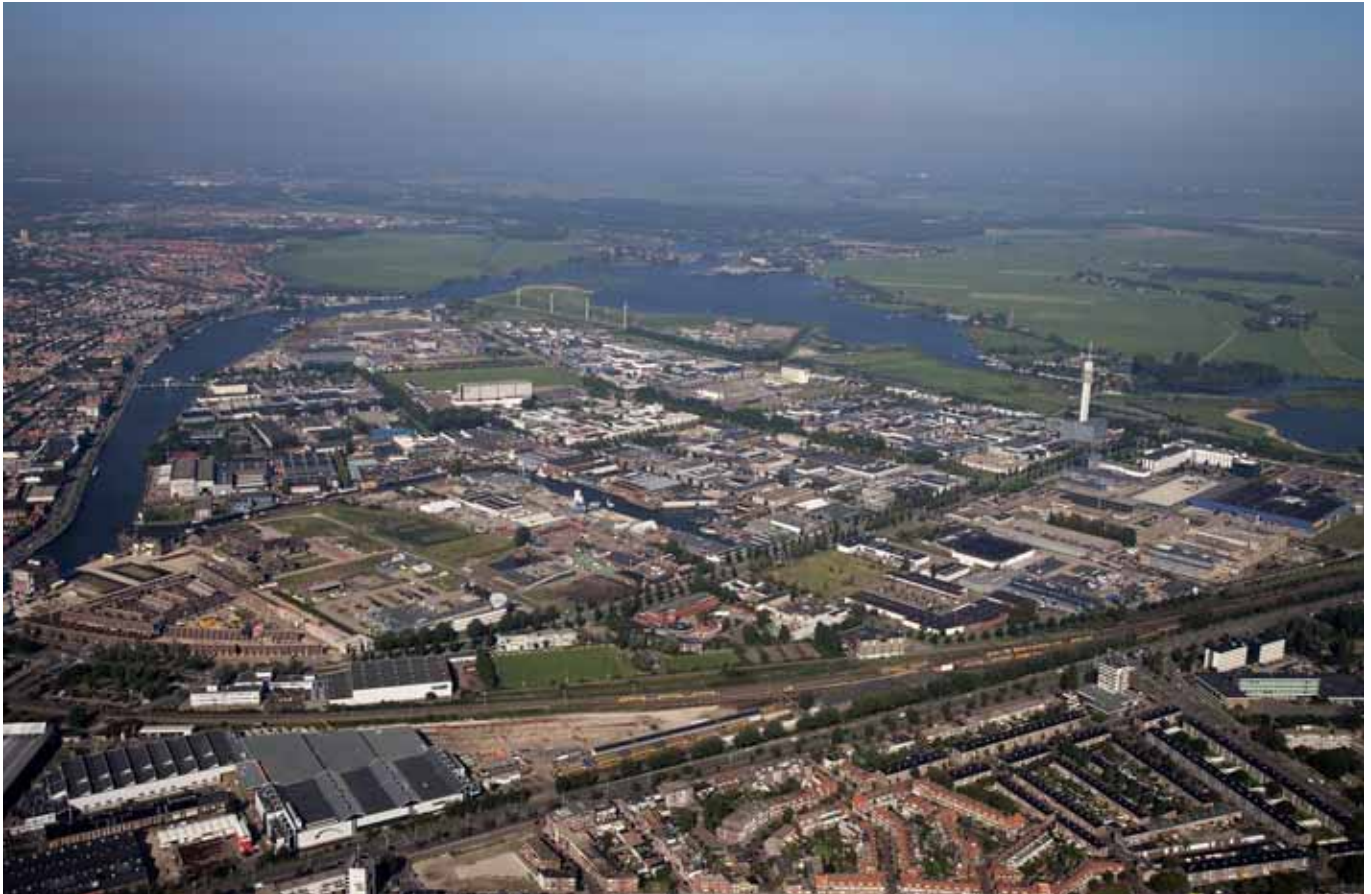
Het bedrijventerrein de Waarderpolder in Haarlem.

een monitoringsplan opgesteld om de hydraulische en zuiverende werking de komende jaren te kunnen meten. De toename aan verhard oppervlak van de nieuwe ontsluitingsweg wordt volledig gecompenseerd door de wadi. Er vindt zelfs overcompensatie plaats ter grootte van 0,8 hectare verhard oppervlak.