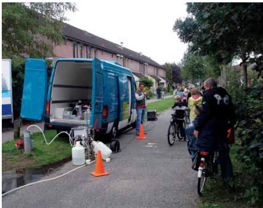
Microbiologische bemonstering van een waarnemingsput.

tratie de resultaten sterk te beïnvloeden. Hierdoor bleken cafeïne en borium minder geschikt als indicatorparameter.