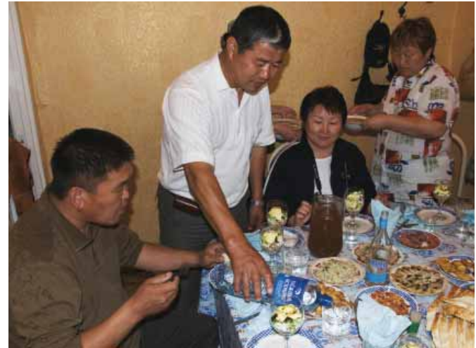
Baikalwater staat bij veel mensen op tafel: drinkwater dat op 400 meter diepte uit het Baikalmeer wordt gewonnen.

afvalwater. "We hebben nu naast federale ook lokale wettelijke middelen in handen om op te treden tegenover vervuilende industrieën. En dat heeft effect. Verschillende bedrijven hebben aanzienlijke verbeteringen aangebracht aan hun afvalwaterzuiveringsinstallatie." Maar Ganzjurova is nog niet tevreden met de huidige wetgeving. "We moeten de wetgeving nog meer aanscherpen om effectief bedrijven en