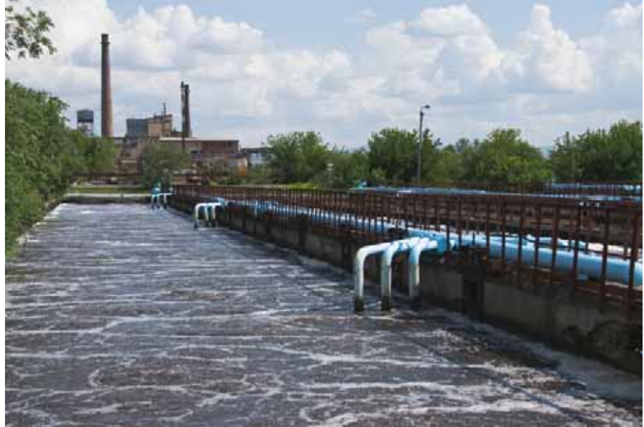
De beluchtingreservoirs van de afvalzuivering.

De afvalwaterzuiveringsinstallatie van Oelan Oede blijft ruim onder de toegestane milieunorm: “Het afvalwater dat de zuiveringsinstallatie in gaat, bevat 110 tot 175 milligram vervuiling per liter. Dat is na zuivering teruggebracht tot acht milligram per liter.” Nicolavitch laat zijn analist op kantoor komen om het verschil te demonstreren in twee kolven. “Volgens onze strenge milieunormen mag dat maximaal 12 milligram bedragen. Daar blijven wij onder. Het water is zo schoon dat het drinkbaar is,” zegt Victor. Om dat te demonstreren, neemt hij een slok water. Ondergetekende doet het hem niet na en