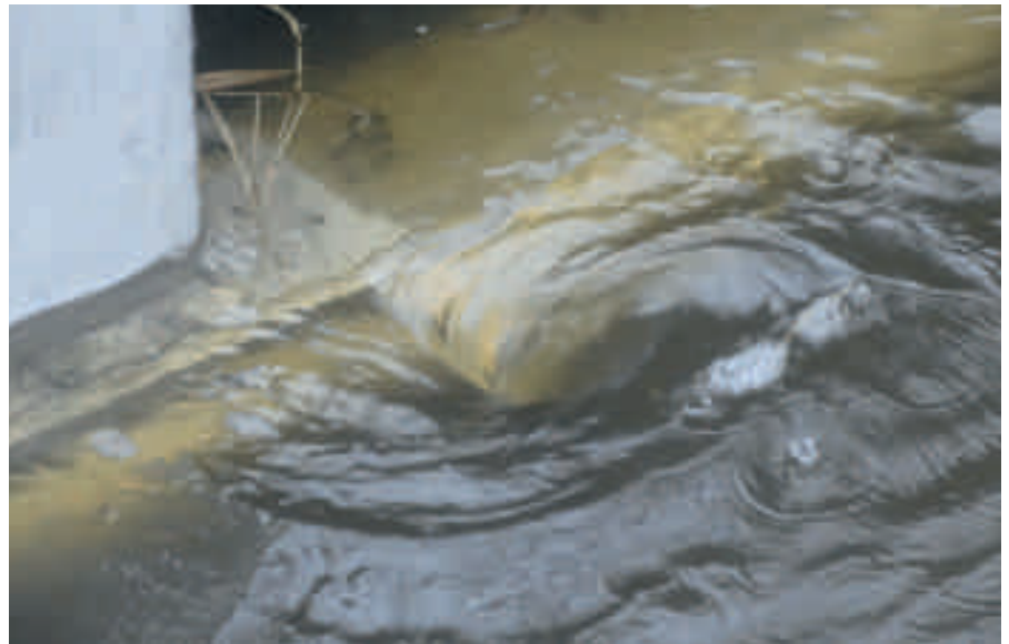
Werveling achter een cilinder.