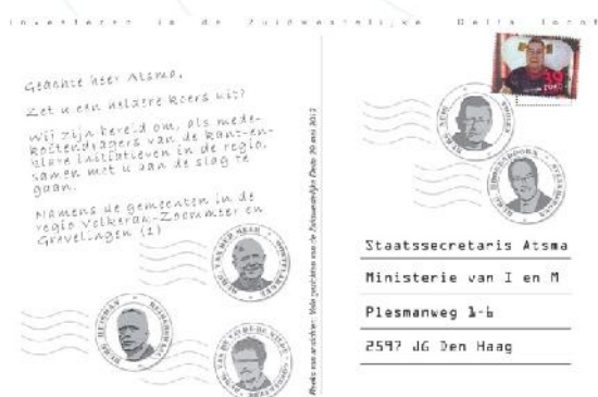
Figuur 2 Multi-level governance in de praktijk: gemeenten spreken hun steun uit voor de Zuidwestelijke Delta aan de staatssecretaris

Naast deze bekende vormen van besluitvorming, zien we ook twee nieuwe vormen. Zo zien we dat het door procedures mogelijk is om de acties in de verschillende netwerken in een ketting te schakelen op weg naar besluitvorming. Zo is bijvoorbeeld het halfjaarlijkse gesprek met de staatssecretaris en het programma Zuidwestelijke Delta onderdeel van een procedure. Met deze procedure is het mogelijk alle voorbereidende acties in rij en gelid te zetten. Zo hebben bijvoorbeeld de gemeenten hun steun expliciet via een ansichtkaart uitgesproken net voorafgaand aan het gesprek met de staatssecretaris in 2012 (figuur 2). Als tweede zien we dat de procedures die zich op verschillende plaatsen ontwikkelen worden gesynchroniseerd door persoonlijke netwerken en onderlinge interacties. Juist deze vorm van besluitvorming leidt tot besluiten die op een relatief groot draagvlak kunnen rekenen.