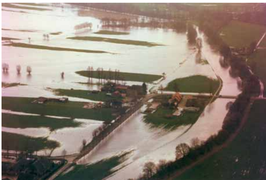
Wateroverlast Leusbroek-Voskuilen bij Leusden in 1998.

Naar de invloed van klimaatverandering op waterkwaliteit en ecologie is tot op heden weinig onderzoek verricht. Situaties met langere perioden van droogte afgewisseld met hevige buien zullen de kwaliteit van het rwzi-effluent en riooloverstorten negatief beïnvloeden. Extremere situaties met betrekking tot wateroverlast en watertekort kunnen leiden tot meer af- en uitspoeling van nutriënten. Het ecologische functioneren van wateren kan worden beperkt door onvoldoende stroming en onvoldoende waterdiepte. Temperatuurstijging zorgt met name in stilstaand water in combinatie met eutrofiëring tot een toename van de knelpunten met betrekking tot blauwalgen, kroos en botulisme. Mogelijke adaptatiemaatregelen hangen vooral samen met het tegengaan van watertekort. Daarnaast zijn maatregelen gericht op een betere doorstroming, saneren van riooloverstorten en baggeren effectief.