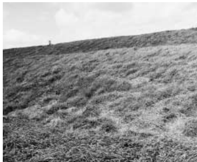
Niet afgevoerd blootsel.

Wilde gerst (kruipertje) komt in Zeeland veelvuldig voor en varieert in omvang van 0 % tot 30 % van de totale oppervlakte aldus de pachters. In één enkel geval wordt zelfs aangegeven dat het om 80 % gaat. De schapenhouders