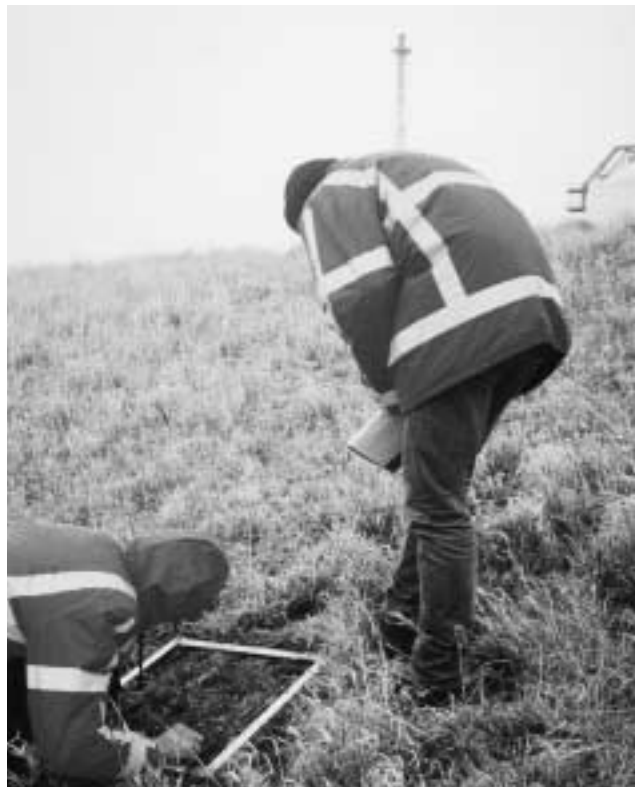
Bedekkingsbepaling in Zeeuws Vlaanderen.

pen met de beoordelingsformulieren van dhr. H. Sprangers geven de deelnemers aan dit onderzoek voldoende inzicht in de huidige kwaliteit van de grasbekleding van zeedijken. De relevante bepalingen op deze beoordelingsformulieren komen deels overeen met de bepalingen zoals die in de definitieve of groene versie van de "Leidraad toetsen op veiligheid" (respectievelijk TAW, 1999 en TAW, 1996) staan. Hieronder worden de beoordelingscriteria kort toegelicht.