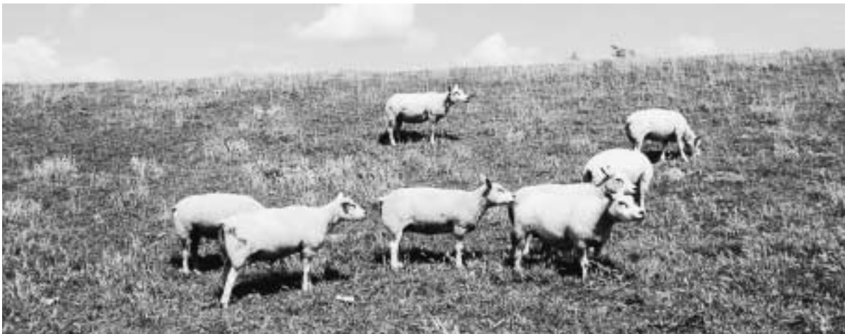
In het pachtcontract is vaak een maximale veebezetting opgenomen.

De werkelijke oppervlakten, gecorrigeerd voor de helling, worden verpacht voor f 500,- per hectare en (op één uitzondering na), uitgegeven in éénjarige pachtcontracten. De naast elkaar gelegen vakken (van ongeveer gelijke grootte, 3 à 4 hectare) worden in even aantallen en aan één gesloten uitgegeven (2-4-6). De pacht prijs is behalve een vergoeding voor het gebruik van de zeedijken ook een vergoeding voor het door het waterschap uitgevoerde graslandbeheer, de gemaakte kunstmestkosten, het gebruik van de drinkwatervoorziening (afhankelijk van de oppervlakte 1 à 2 drinkputten per perceel) en het waterverbruik. De afrasterkosten blijven beperkt tot het onderhoud aan de dwarsafrasteringen