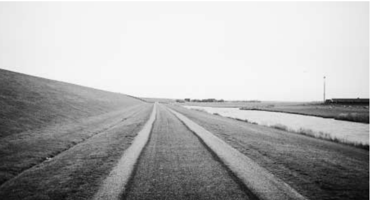
Weg op de binnenberm van de zeedijk.

In hoeverre tasten foeragerende rotganzen en smienten (graasgedrag, bemesting) de zeewerende functie van de dijk aan? Is dit uitsluitend een gevolg van het grasbeheer met schapen? Is dit waterwild verenigbaar met het houden van schapen op zeedijken? Deze vragen moeten zeker gesteld worden in het kader van de kwaliteit van de grasbekleding. Een opbrengstderving door foeragerende eenden en ganzen is duidelijk (later inscharen in voorjaar). Soms blijven de ganzen tot juli. De uiteindelijke omvang van de opbrengstderving is onbekend. Rotganzen geven duidelijk de voorkeur geven aan bemeste percelen. Eénmaal wordt gesuggereerd dat het houden van een klein aantal schapen op de zeedijken in de wintermaanden de schade beperkt.