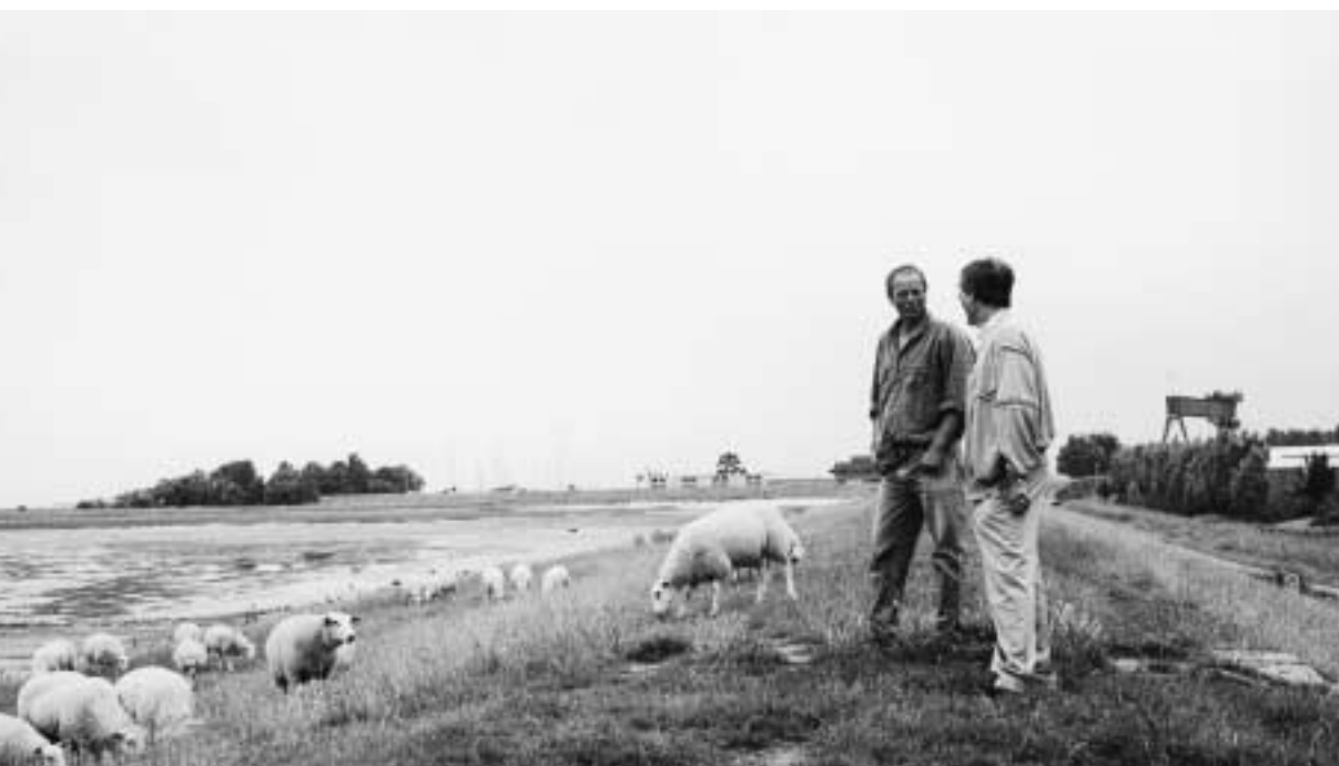
Overleg tussen schapenhouder en waterschap.

Wanneer de (onderhouds-)werkzaamheden door de pachter worden uitgevoerd zoals bemesten, slepen, maaien/bloten, inzaaien van kale plekken is deze verantwoordelijk voor correct beheer. Vooral de stikstofgift, welke uitermate bepalend is voor de extensivering, is dan niet meer te controleren. Vertrouwen in de pachter