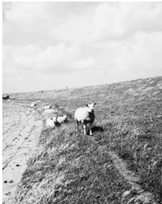
Ongewenst looppad van schapen.

In aanvulling op bovenstaande tabel is per deelnemer het beheer kort samengevat en waar mogelijk gerelateerd aan de kwaliteitsscores.