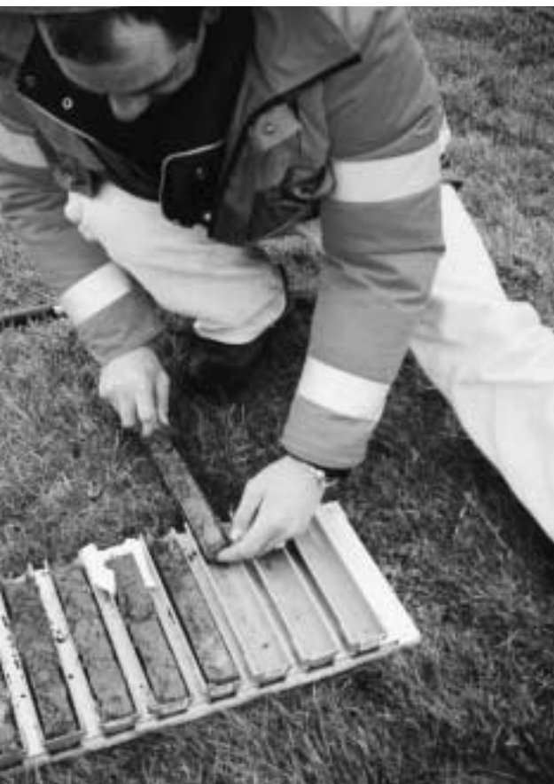
Doorwortelingsbepaling in Friesland.

De uitgevoerde beoordeling van de kleikwaliteit is globaal en verschaft weinig aanvullende infor-