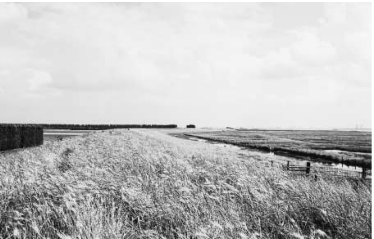
Dijkperceel met veel wilde gerst in het grasbestand.

hangt daarom vooral af van het voorkomen van kale plekken. Voorts bestaat de indruk dat verschraling de wilde gerst doet verdwijnen. In hoeverre wilde gerst verspreid in het bestand een bedreiging vormt voor de kwaliteit van de dijk is nog de vraag en hangt af van de doorwortelingsdiepte. Wilde gerst wordt niet genoemd in de lijst van de indicatorsoorten met een goede of slechte doorworteling (TAW, 1996). Daarom mag er vanuit gegaan worden dat deze soort een normale doorworteling heeft. Als wilde gerst pleksgewijs voorkomt kunnen, nadat het gewas is uitgebloeid en de omstandigheden voor een tijdige verversing (ontkieming) ongunstig zijn (droogte), ongewenste kale plekken ontstaan. Hierdoor neemt de erosiebestendigheid af. Voor een goede kwaliteit van de grasmat is daarom het vinden van bestrijdingsmethoden bijzonder wenselijk.