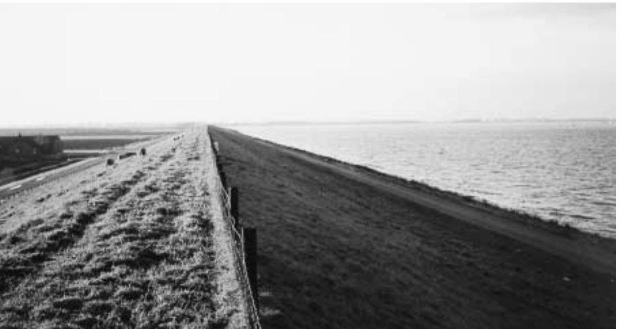
Schapehouderij op zeedijken: "multifunctionele landbouw".

In hoofdstuk 3 worden algemene aspecten behorende bij het gebruik van zeedijken (contractvorm, medegebruik en andere) besproken. Om inzicht te krijgen in het gewenste dijkbeheer en de relatie tussen dijkbeheer en de kwaliteit van de grasbekleding zijn in hoofdstuk 4 de relevante beheersaspecten als bemestingsniveau en beweidingduur en intensiteit naast de kwaliteitsscores geplaatst.