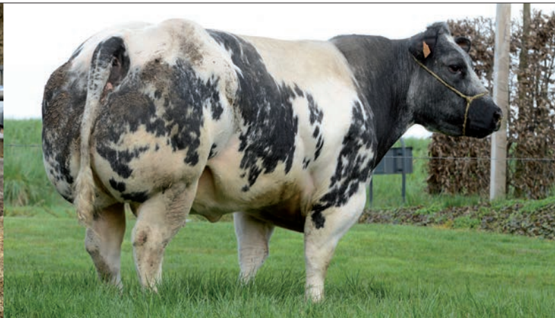
Gantoise de Mahoney is met 90,9 de hoogst gepunte koe op het bedrijf Godin van de IJzer behaalde dit jaar in Gent een eerste plaats