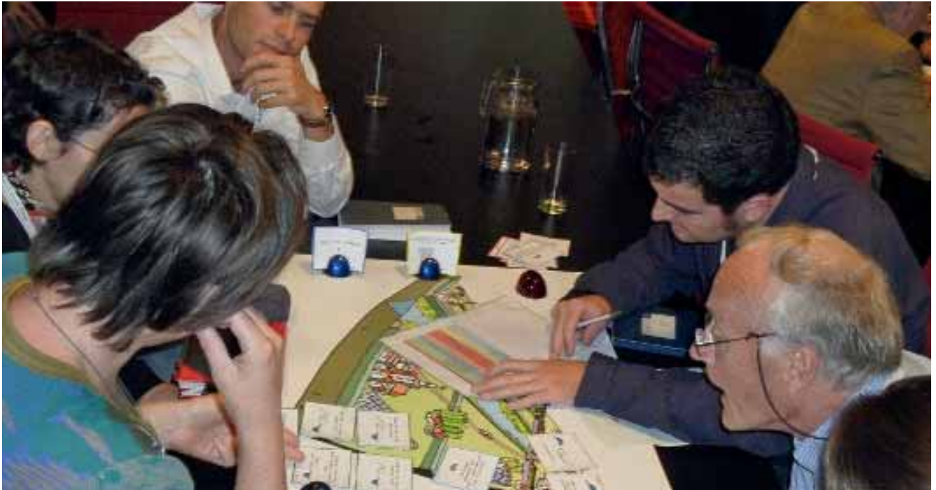
Het spelen van 'Duurzame Delta':

vragen om meer natuur. Of er kunnen gezaghebbende mensen ontstaan die de discussie over bijvoorbeeld klimaatverandering een bepaalde kant op duwen. Dit is te vergelijken met wat recentelijk in werkelijkheid ook gebeurde: politici gingen klimaatverandering pas serieus nemen toen Al Gore zich daar druk om maakte. Wat daarmee verandert, is het publieke perspectief en hiermee het draagvlak: wat eerder vanzelfsprekend leek, blijkt later onmogelijk uit te voeren. In het spel krijgt de publieke opinie een rol door krantenberichten en 'publiek draagvlak' dat reageert op gebeurtenissen in het spel 4 .