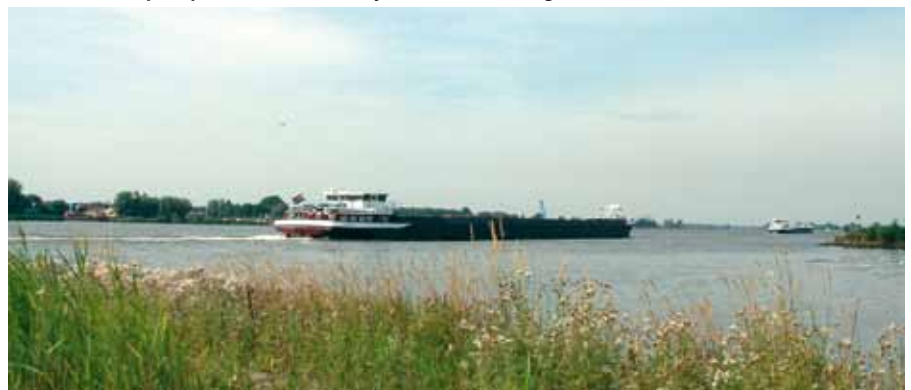
Binnenvaartschepen op de Boven Merwede bij de Dordtsche Avelingen.

tingsplaatsen voor binnenvaartschepen op het traject Haften-Rotterdam en Haften-Volkerak. Rijkswaterstaat is op zoek naar 38 extra ligplaatsen langs de Boven Merwede en/of Beneden Merwede. Rijkswaterstaat heeft hiervoor drie mogelijke locaties geselecteerd in het KRW-waterlichaam 'Sliedrechtse Biesbosch': Polder Stededijk, Dordtsche Avelingen en Woelse Waard/Dalemse Gat. In Polder Stededijk is reeds een kleine opslag/overlaghaven van Rijkswaterstaat aanwezig. Het omringende terrein is in agrarisch gebruik. De rest van de polder is grotendeels bestemd voor de ontwikkeling van 30 hectare zoetwatergetijdennatuur (KRW-inrichtings-