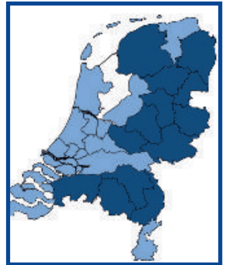
Afb. 2: De 13 waterschappen waarvan gegevens voor de gebiedsreferentie verzameld zijn (donkerblauw).

In de referentiedatabank bevinden zich 76 gebiedsreferenties, gebaseerd op min of meer homogene zones uit 40 waterbergingsgebieden binnen de werkvelden van 13 waterschappen (zie afbeelding 2). Afbeelding 3 laat zien van hoeveel gebieden een bepaald aantal parameters aanwezig is. Uit deze afbeelding blijkt dat van geen van de referentiegebieden alle gewenste gegevens aanwezig zijn. Van slechts vijf procent van de referentiegebieden zijn 90 procent van de gegevens beschikbaar. Hieruit blijkt dat de monitoring van waterbergingsgebieden niet één op één aansluit met de gegevens die gewenst zijn voor het beoordelen van lokale overstromingseffecten of het toepassen van de BOB. Voor alle referentiegebieden zouden aanvullende metingen verricht moeten