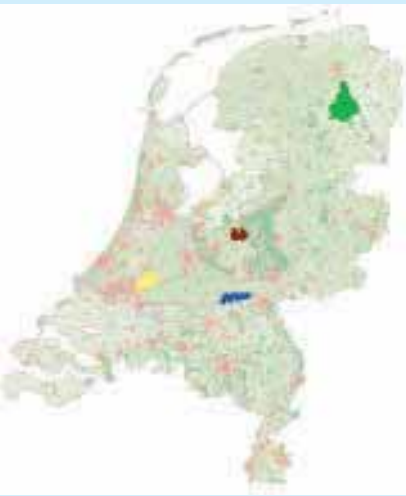
Proefgebieden Monitoring Stroomgebieden.

In het project Monitoring Stroomgebieden doen Alterra en Deltares onderzoek naar de nutriëntenstromen in vier proefgebieden (Krimpenerwaard, Quarles van Ufford, Schuitembeek en Drentse Aa). Daar wordt onderzocht wat de effecten van het mestbeleid zijn op de kwaliteit van het oppervlaktewater. De stroomgebiedsgerichte aanpak kan als voorbeeld dienen voor het nutriëntenonderzoek in andere stroomgebieden. De gadoliniummetingen in Quarles van Ufford geven informatie over de herkomst van het water en de nutriënten in het gebied. Daarmee verbetert de interpretatie van de waterkwaliteitsmetingen. De meetresultaten worden ook gebruikt voor de validatie van water- en stoftransportmodellen.