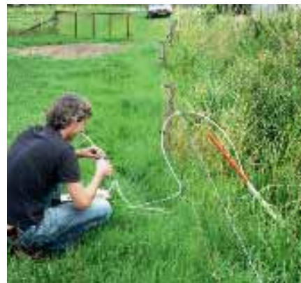
C. Bemonstering van de kopsloot vanaf de rivierduin.

zeldzame aarden. Dat geldt echter niet voor het gebiedseigen drainagewater en de kwel. Met een ruimtelijk beeld van de gadolinium-anomalie kan de invloed van het inlaatwater in het gebied worden herleid.