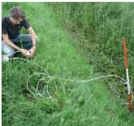
B. Bemonstering van een landbouwsloot.