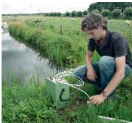
A. Bemonstering van een hoofdwaterloop.