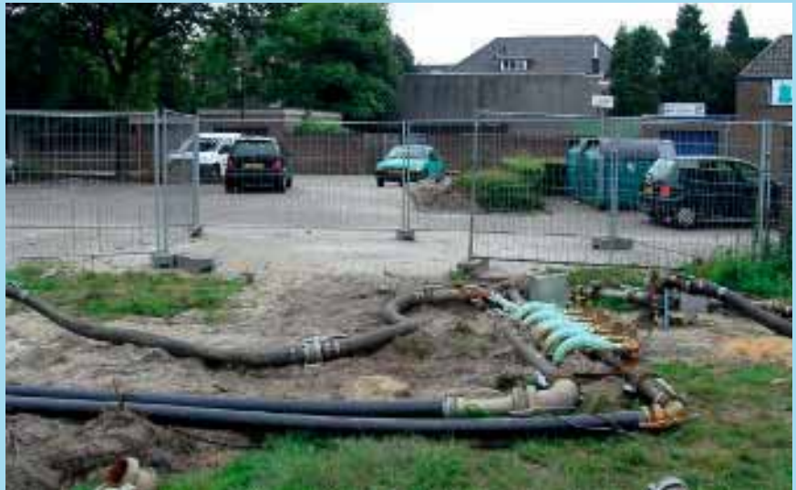
DSI-retourbemaling binnen het bouwterrein.

Door een recente innovatie op het gebied van retourbemalen, het DusenSaug-Infiltration-retoursysteem (DSI), is het mogelijk om grondwater onttrokken met verticale filters op korte afstand van de onttrekking in dezelfde bodemlaag terug te brengen, zonder dat dit leidt tot een significante toename van het debiet. Deze wijze van retourbemalen resulteert enerzijds in een netto onttrekking van praktisch nul en anderzijds kost het minder energie door de korte transportafstand en door de beperktere onttrekking met verticale filters in plaats van deepwells (ongeveer 25 procent reductie) en het niet aanwezige tot sterk gereduceerde rondpompeffect. Met deze innovatieve retourbemalingstechniek zijn de nadelen van de traditionele retourbemaling opgelost.