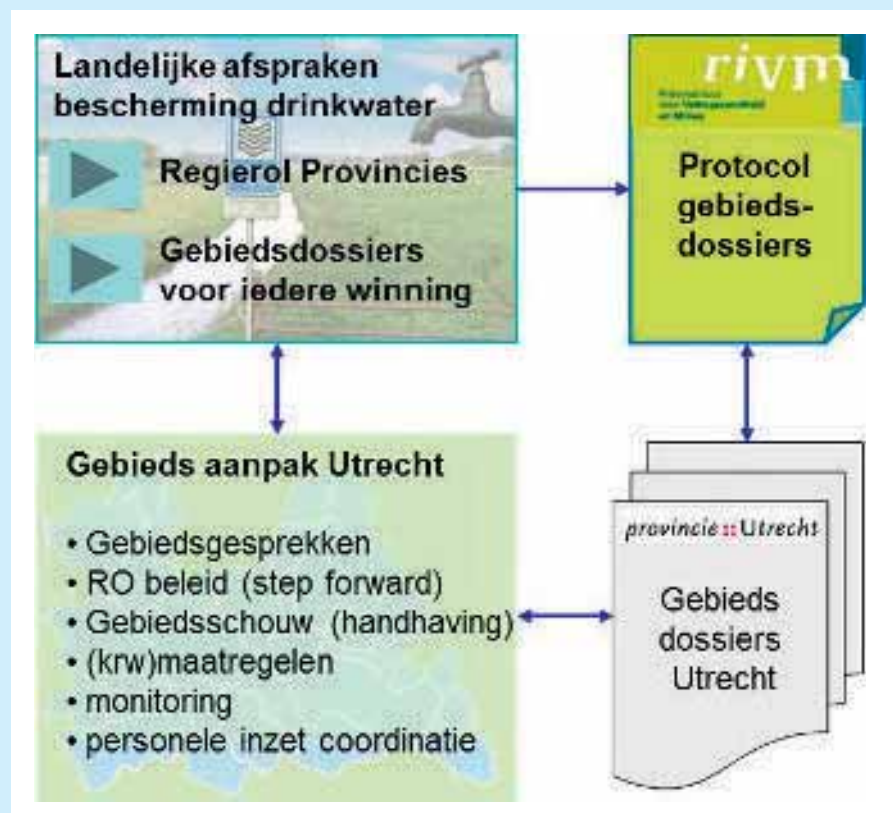
Afb. 1: Samenhang gebiedsdossier en -aanpak bescherming drinkwaterbronnen.

De eerste ervaringen laten zien dat het gebiedsdossier vooral meerwaarde krijgt als tegelijkertijd ook structureel gewerkt wordt aan een gebiedsaanpak waarmee bewustwording en betrokkenheid worden gecreëerd bij de verschillende partijen (met name provincie, gemeente, waterbeheerder en drinkwaterbedrijf) ten aanzien van de winning.