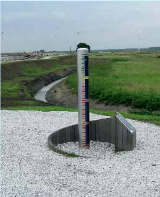
Grondwatermeetpunt langs de Eemdijk.