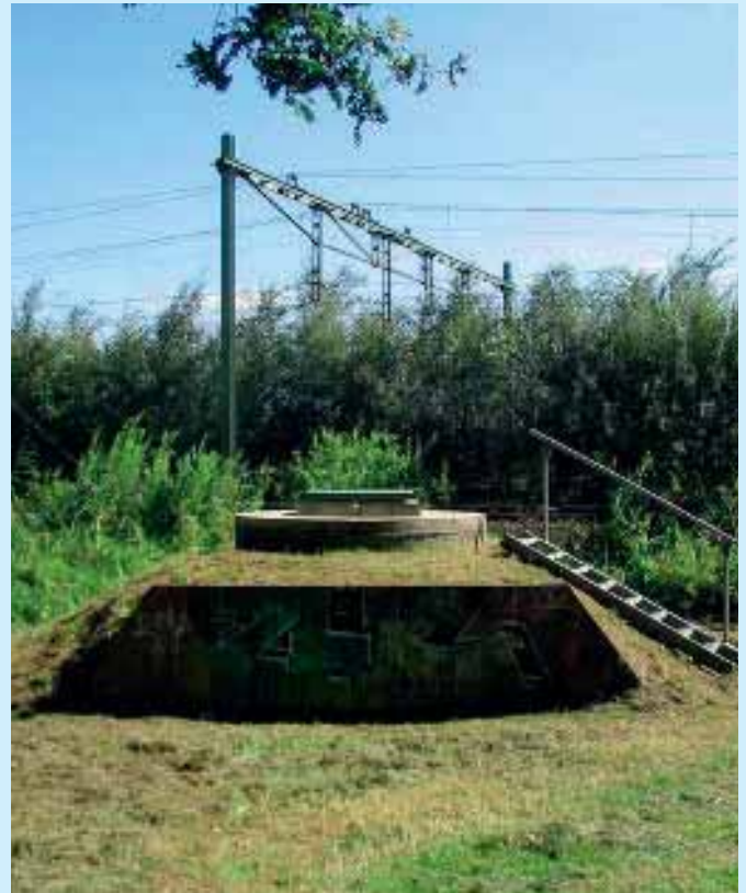
Drinkwaterwinpunt in de provincie Utrecht.

(handhaving), communicatie, voorlichting en onderzoek (wat gebeurt hier of daar) in zich, maar geeft vooral invulling aan gebiedsgerichte samenwerking. De gebiedsschouw vult de reguliere toezichttaak aan. In principe vindt regelmatig, bijvoorbeeld eens per vier jaar, onder regie van de provincie deze gebiedsschouw plaats. De schouw is breder dan alleen het controleren van de bedrijven in het gebied.