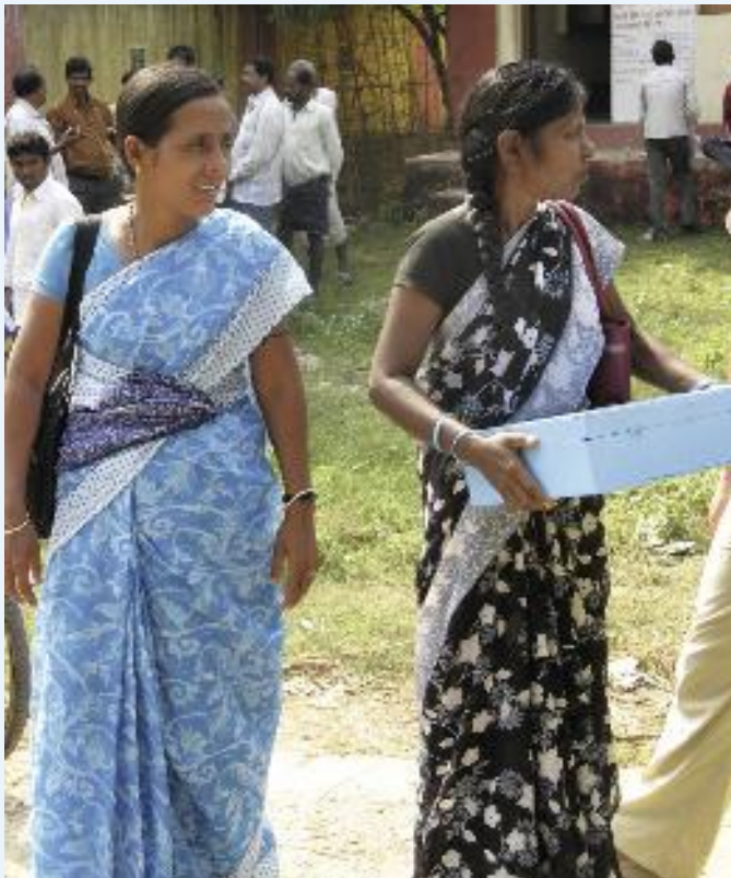
De hydrologen in Dunguruguda.