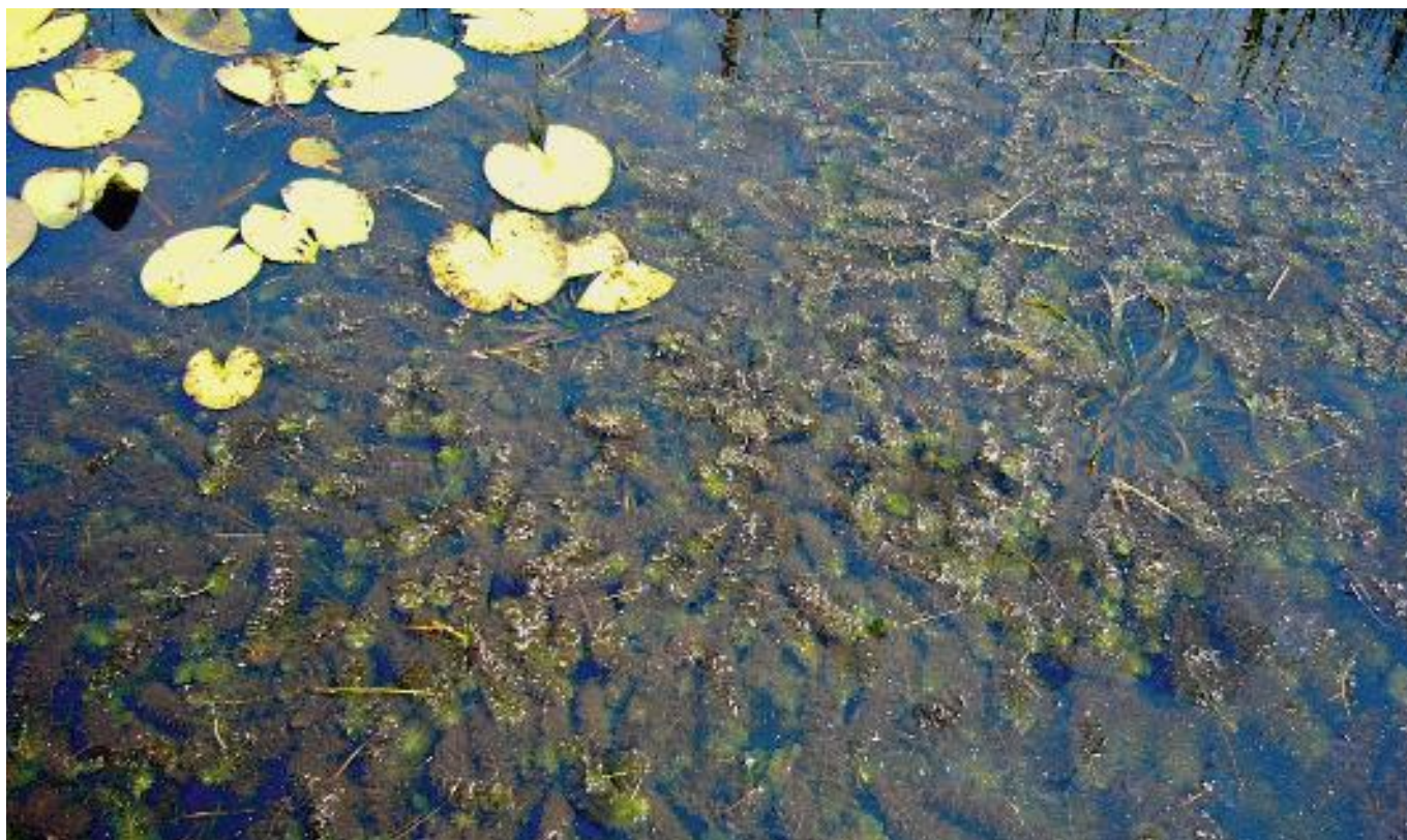
Woekering van grof hoornblad.

hoge fosfaatconcentraties bevat, zullen enkele snelgroeende soorten ondergedoken waterplanten gaan domineren, waardoor de soortenrijkdom laag blijft. Als de fosfaatconcentratie in de bodem laag is, blijft woekering uit en kunnen verschillende soorten ondergedoken waterplanten profiteren van de betere lichtbeschikbaarheid.