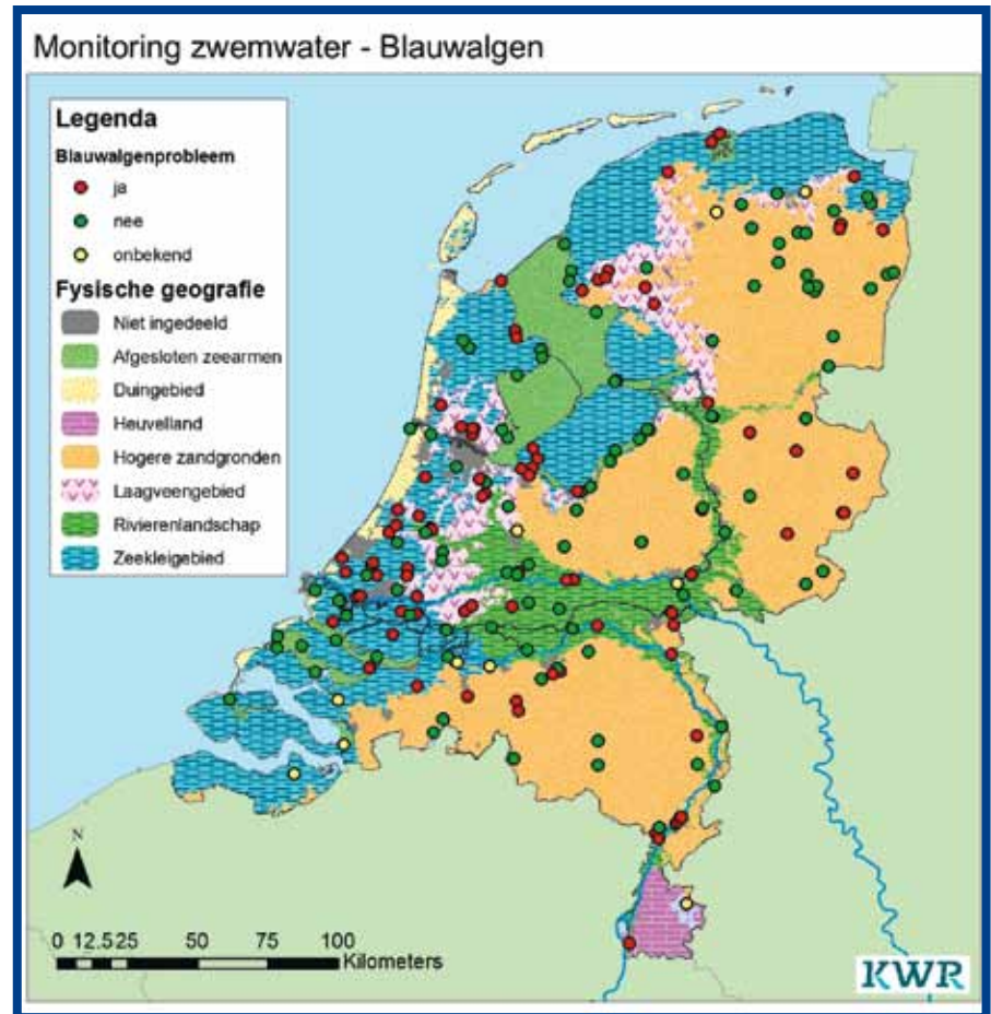
Afb. 3: Overzicht van zwemwaterlocaties waar in de jaren 2006 t/m 2010 één of enkele keren overlast van cyanobacteriën voorkwam (op basis van 190 random gekozen locaties).

In het deltasenario 'Stoom' worden meer gezondheidsproblemen verwacht als gevolg van zwemmen in oppervlaktewater. Geen