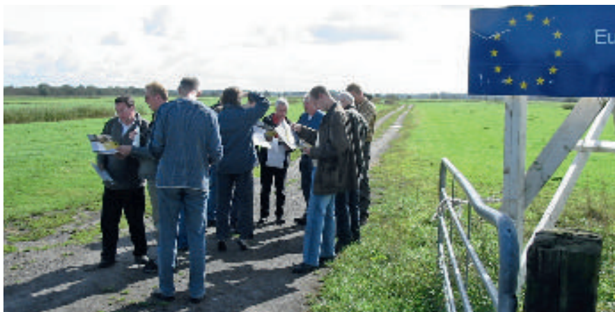
We oriënteren ons vaak op een papieren werkelijkheid, waardoor we oog verliezen voor wat in de praktijk gebeurt.

Wellicht komt dit aspect van 'werkplaatsen' onlogisch over. We richten ons immers op complexe waterprojecten. Waarom dan klein? Is het dan nog wel complex? Ons antwoord: ja. Hoe klein een project ook, de volledige complexiteit komt wel in het spel. De complexiteit heeft namelijk niet zozeer te maken met de omvang van een project maar met de wisselwerking met de omgeving, de context. Binnen de 'werkplaatsen' laten we de context de context en proberen we deze niet binnen het project te trekken. Bij traditionele werkbijeenkomsten wordt integraal werken vaak vertaald met 'het zo compleet mogelijk zijn'. Er worden steeds nieuwe facetten en aspecten benoemd - "want die hebben ook een relatie met ons project" - en er wordt een opsomming gegeven van actoren die erbij betrokken moeten worden. Het compleet zijn lijkt dan een doel op zich. Bij een 'werkplaats' zit de crux in het lokale en concrete. Het gaat om projecten in de praktijk en de intentie is om in die praktijk daadwerkelijk iets te veranderen. Op zich is dat complex.