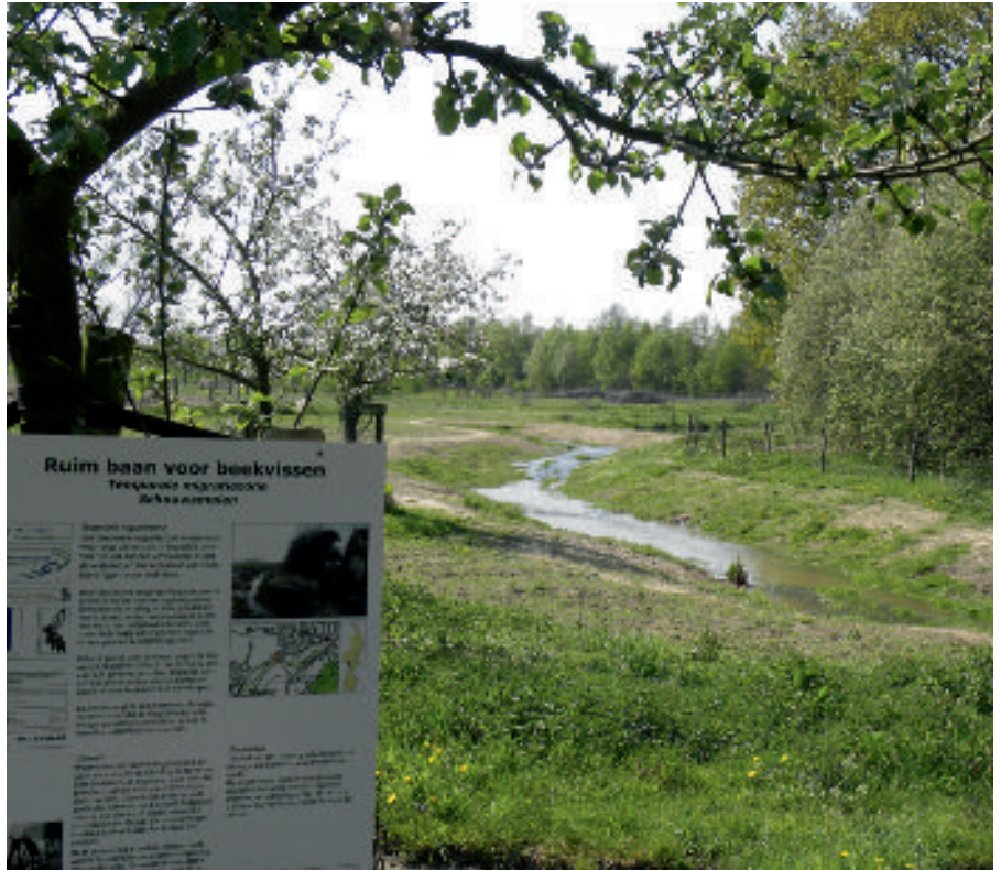
Een natuurlijk ingerichte bypass is alleen bij hogere afvoeren in gebruik. Het is voldoende voor vismigratie. De rest van het jaar fungeert de laagte als een beekmoeras.

De invoering van de Kaderrichtlijn Water heeft het ecologisch waterbeheer weer op de bestuurlijke agenda gezet. Dat leidt er ontegenzeggelijk toe dat de ecologische kwaliteit van veel wateren verbeterd. Om grotere stappen te zetten in de waterkwaliteitsverbetering blijft echter extra inzet nodig. De doelen en maatregelen zijn nog niet altijd goed op elkaar afgestemd en de uitvoering van de maatregelen loopt achter op schema. Een herijking van de doelen en maatregelen kan plaatsvinden in de tweede generatie stroomgebiedsbeheersplannen. Inmiddels zijn er ook meer instrumenten en is ook meer kennis beschikbaar om dit te faciliteren. Maar we zijn er nog niet. Met dit artikel pleiten ondergetekenden voor een herbezinning op de inzet van het gereserveerde KRW-budget met het oog op doelmatigheid en wat haalbaar en betaalbaar is.